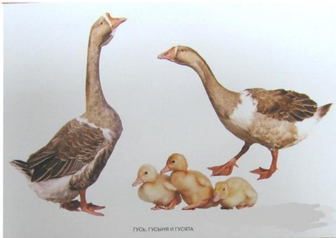
ГУСЬ, ГУСЫНЯ И ГУСЯТА

СПИТ ИЛИ КУПАЕТСЯ, ВСЁ НЕ РАЗУВАЕТСЯ; ДЕНЬ И НОЧЬ НА НОЖКАХ КРАСНЫЕ САПОЖКИ