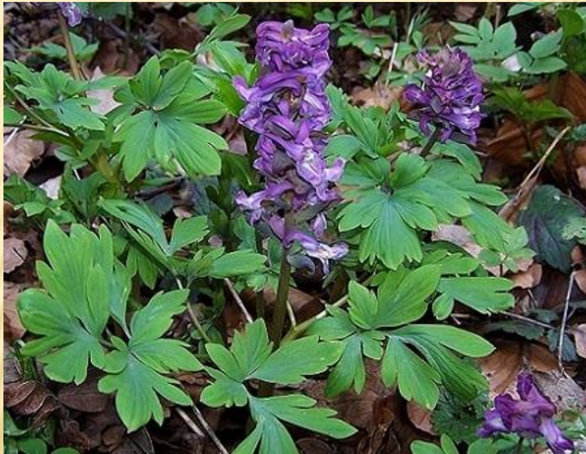
Мирослава Дубрівна, 2-А, КГ № 91