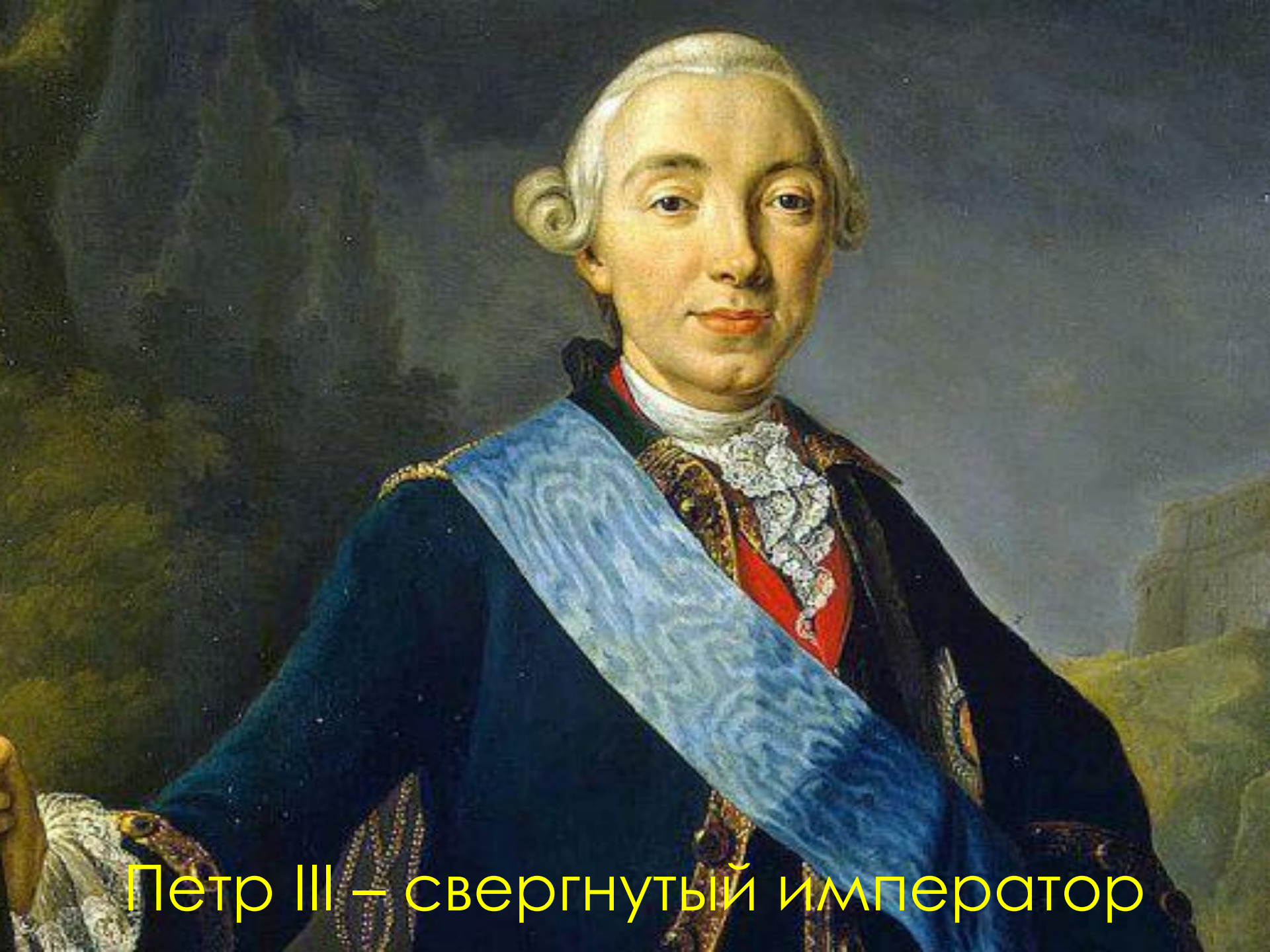
Петр III – свергнутый император