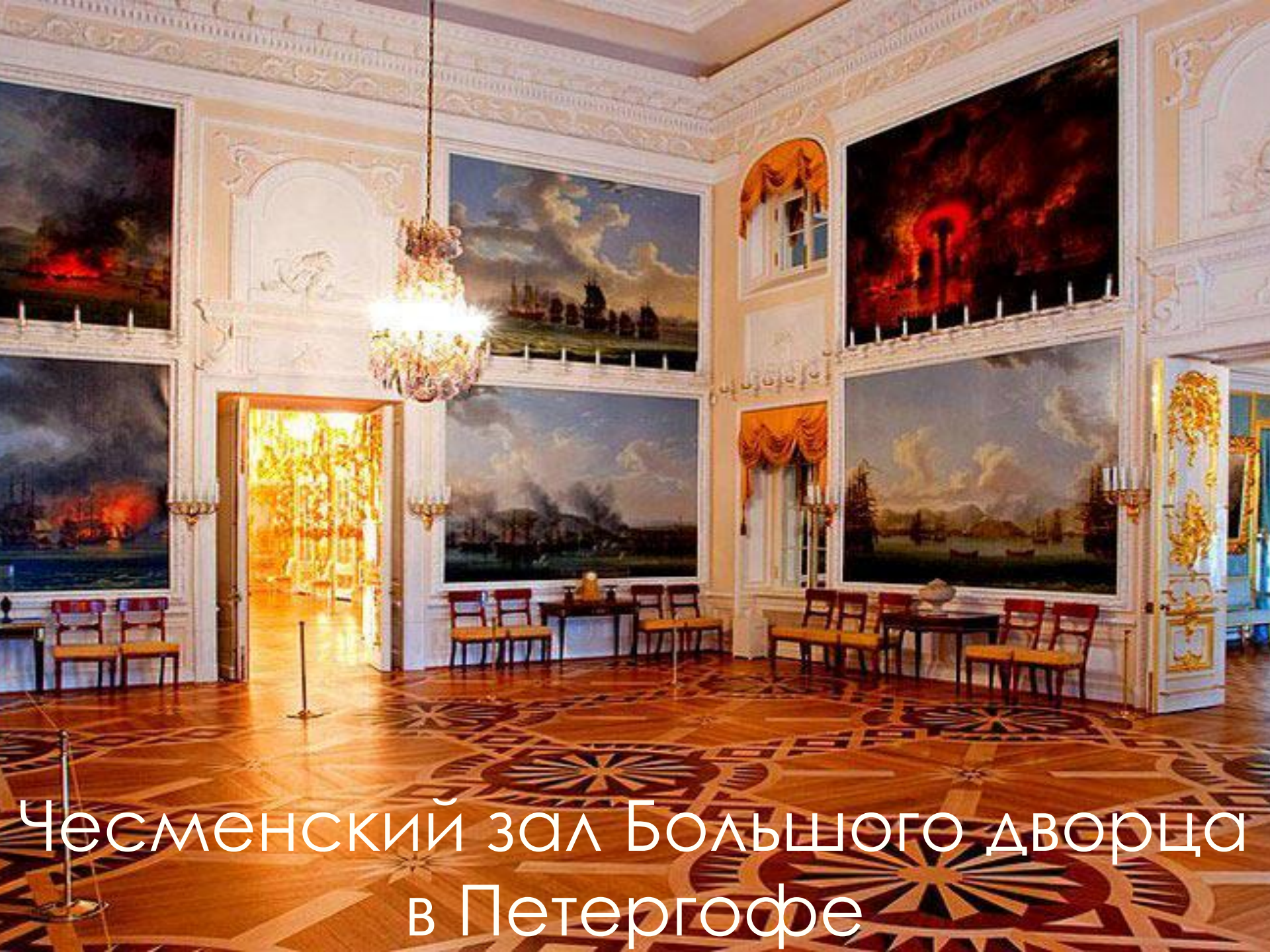
Чесменский зал Большого дворца в Петергофе