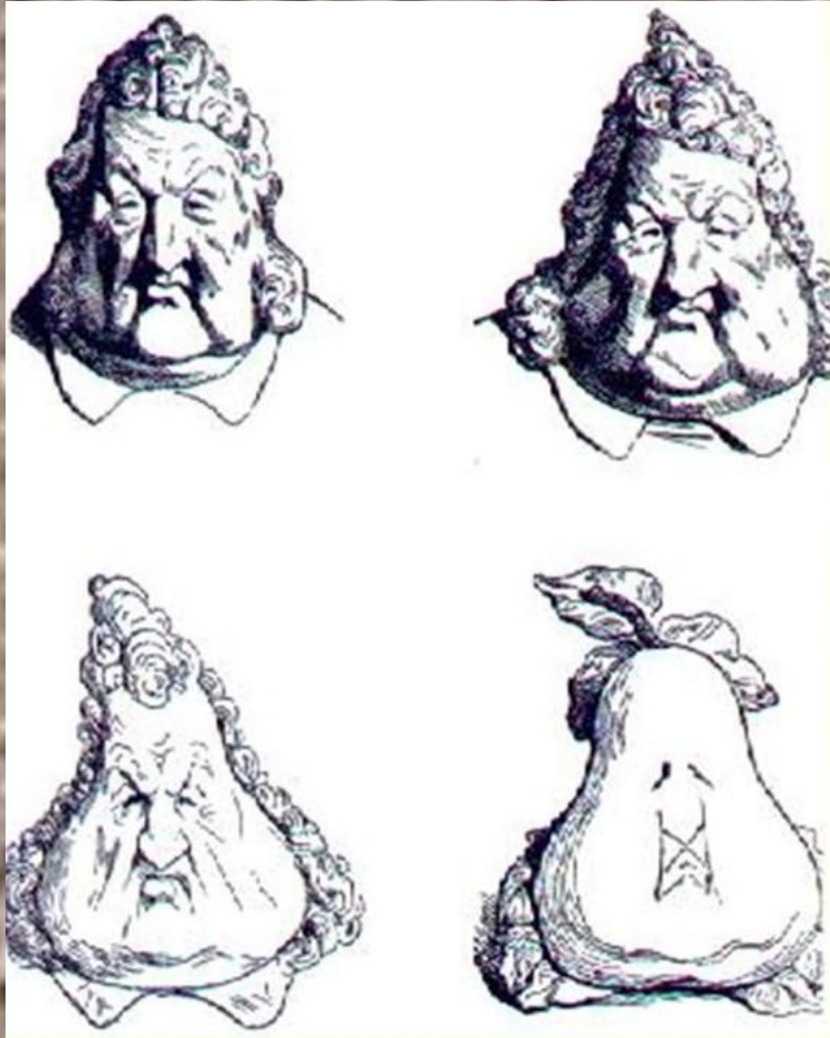
Король-груша. Карикатура на Луи-Филиппа.