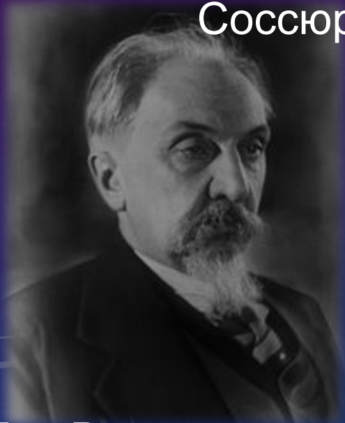
Лев Владимирович Щерба