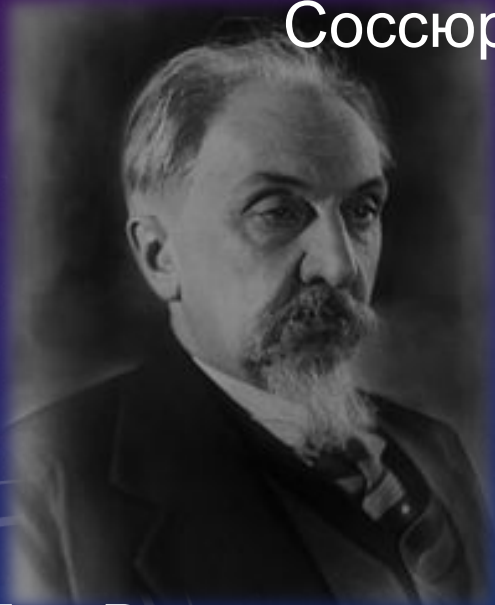
Лев Владимирович Щерба