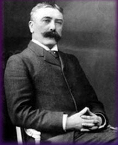
Фердинанд де Соссюр