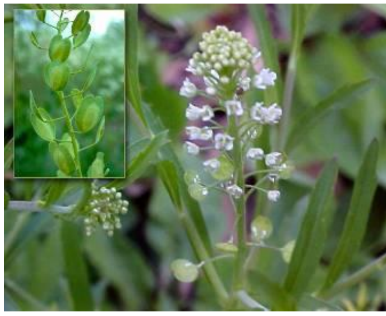
Ярутка полевая ( Thlaspi arvense )