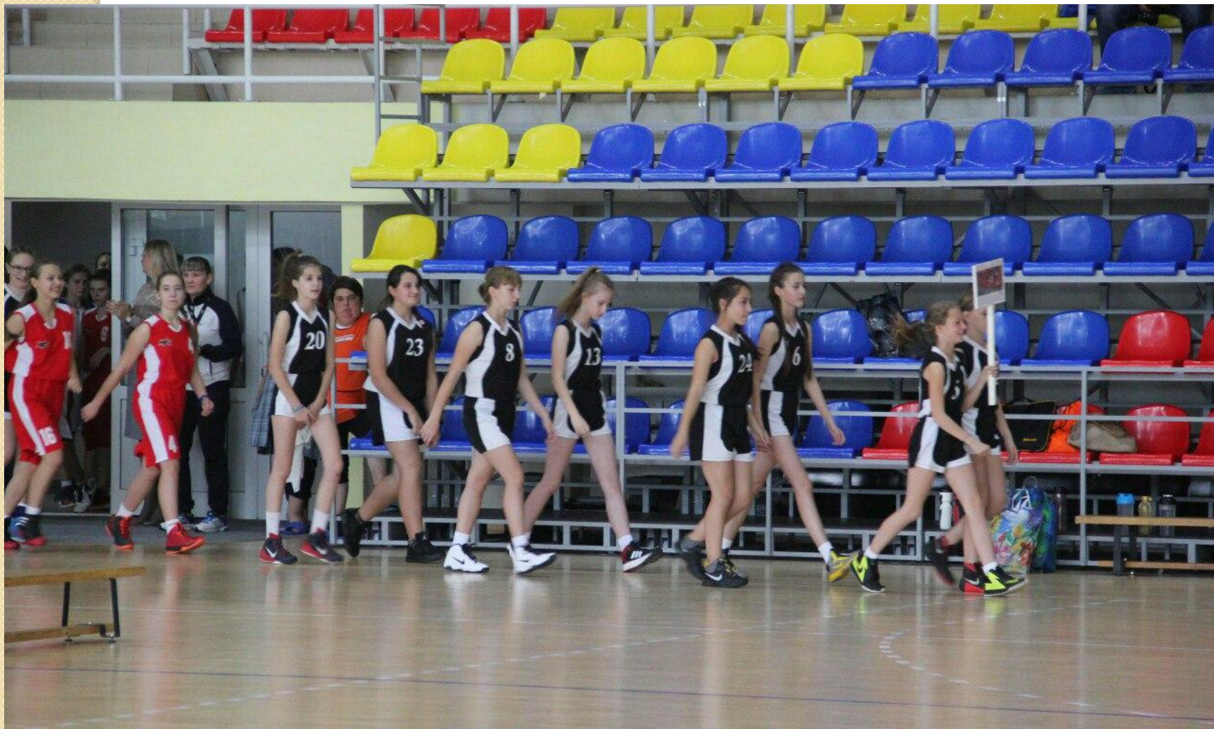
На вручении грамот в Абакане