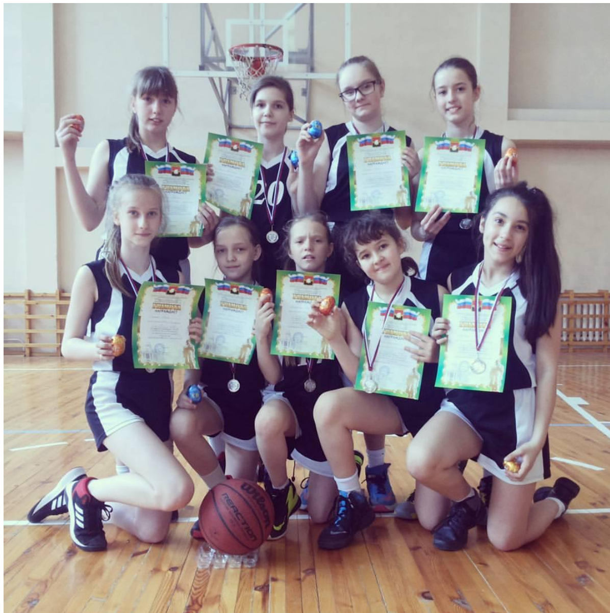
Награждение в Кемерово