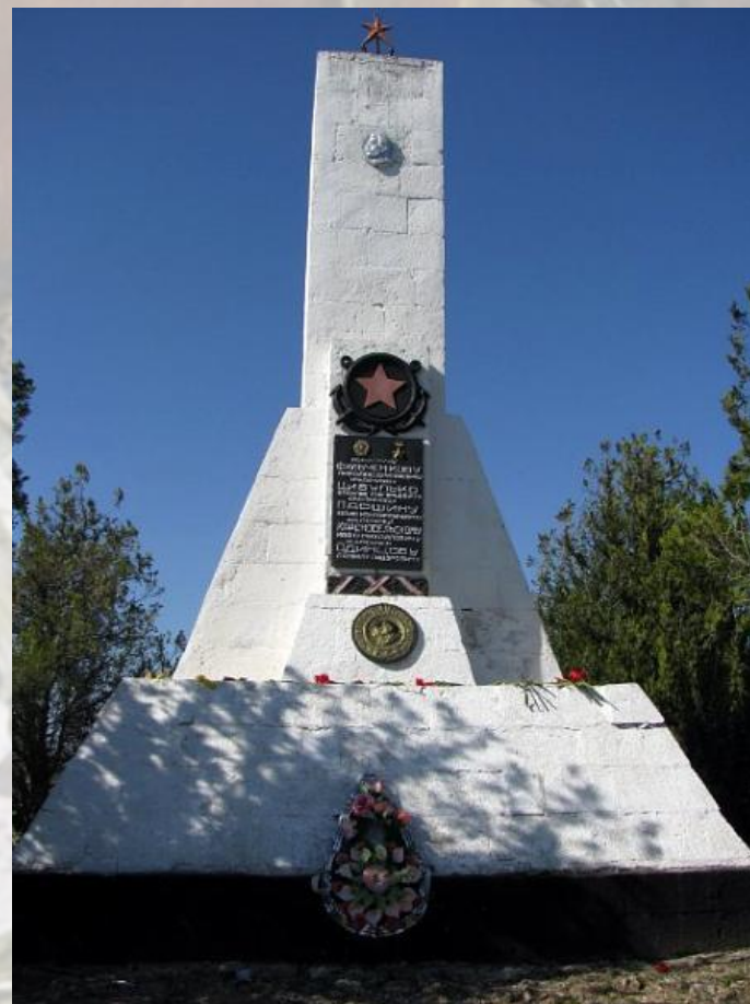
Памятник пяти морякам- черноморцам