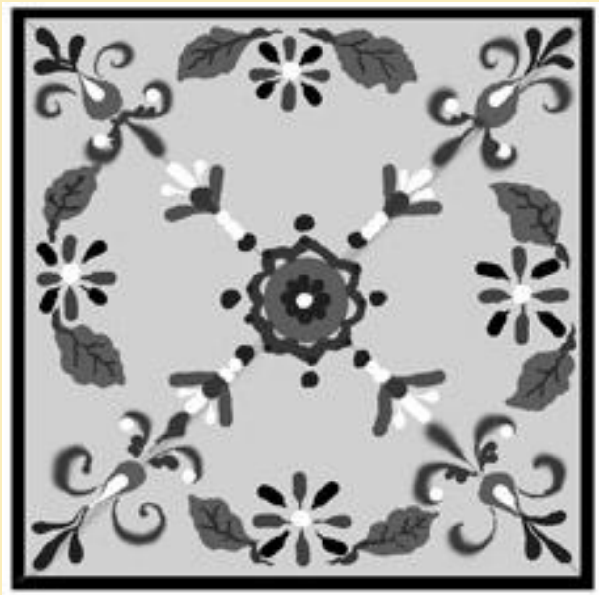
Завершенный эскиз платка