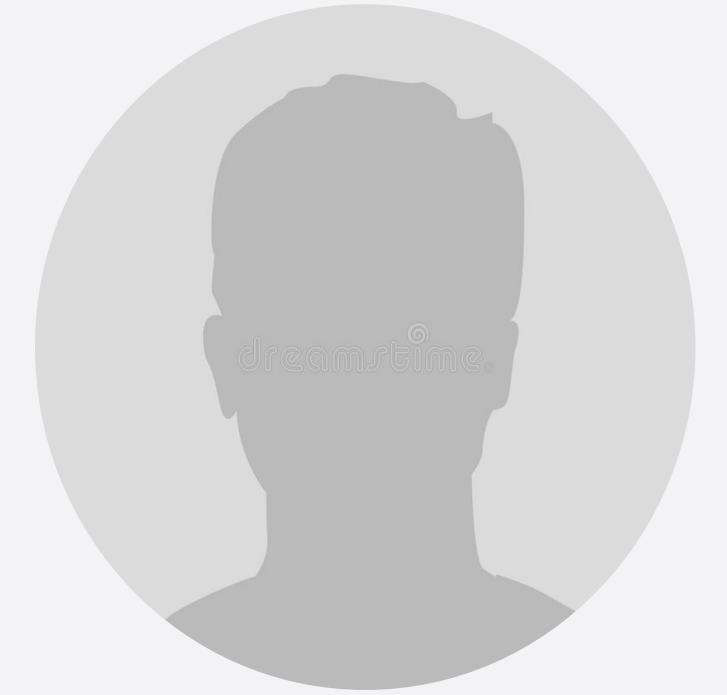
Имя Фамилия Программист