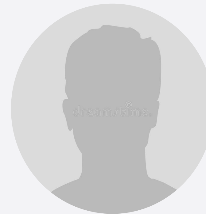
Имя Фамилия Разработчик