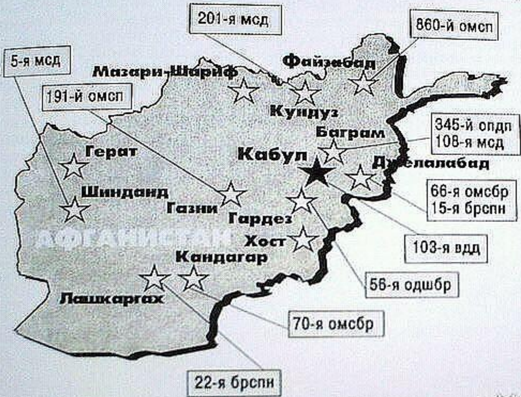
Дислокация Ограниченного контингента советских войск