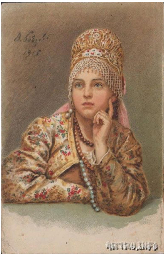
Бобров В.А. Любаша. 1915