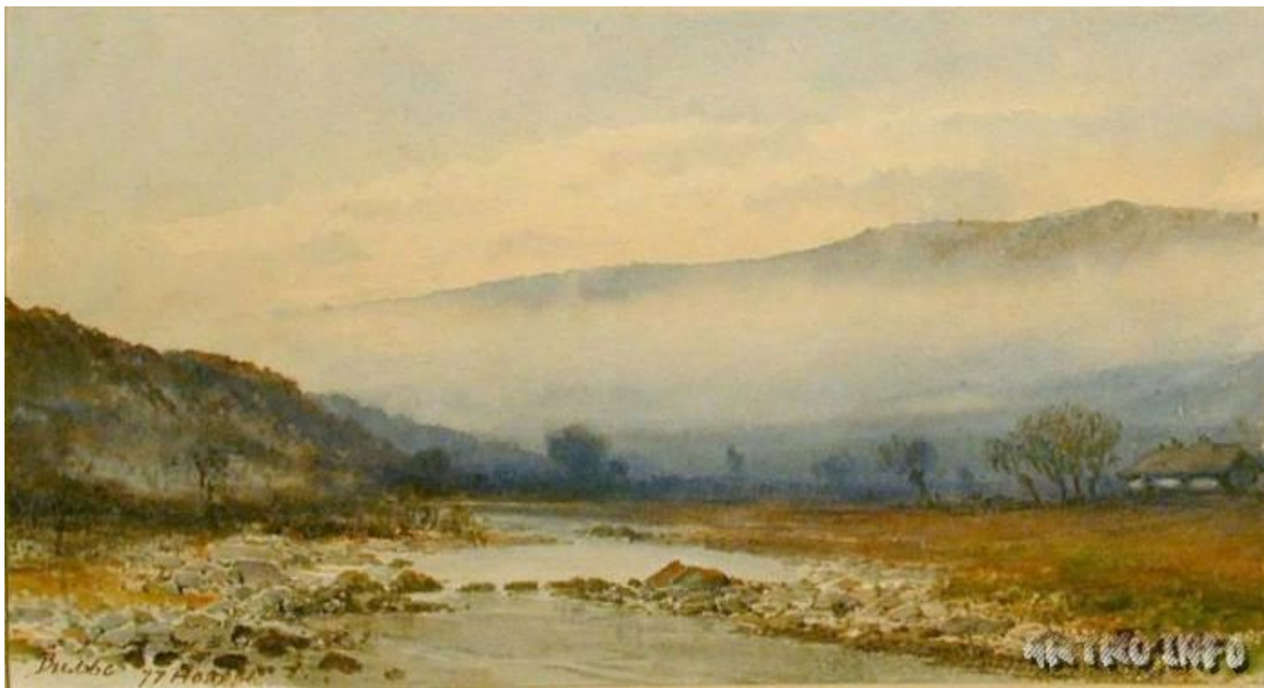
Вилье де Лиль-Адан Э.С. Ручей в горах. 1877. Акварель.