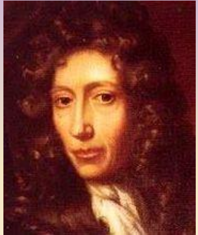
Роберт Бойль (1627-1691 годы)

Смеси – это системы, состоящие из нескольких компонентов, каждое из которых проявляет свои свойства.