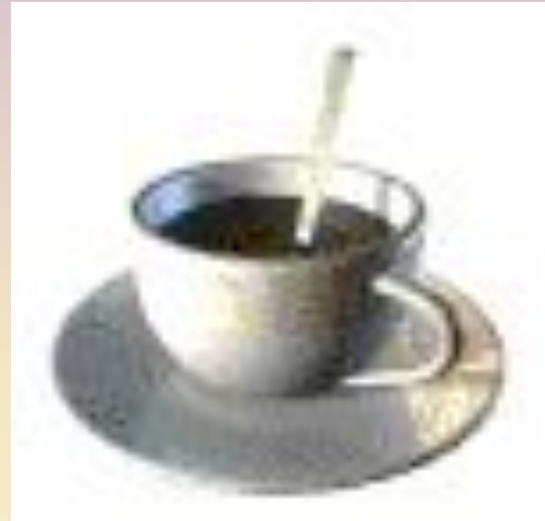
Кофе Смесь тв.-ж