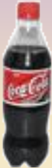
Газированная вода Смесь г-ж