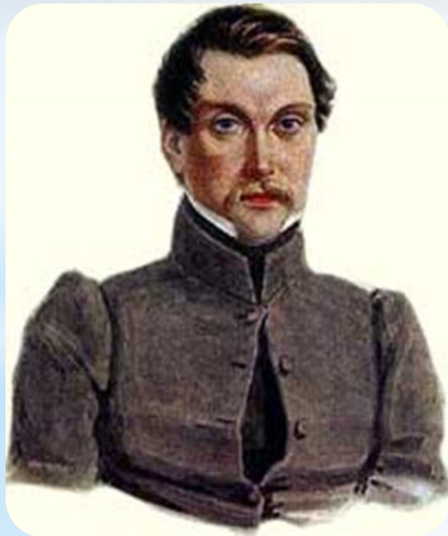
декабрист Иван Иванович Пущин