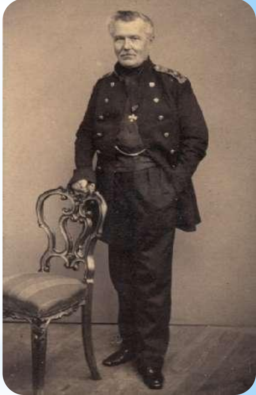
Федор Федорович Матюшкин.