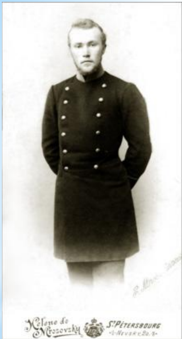
Николай Константинович Рерих