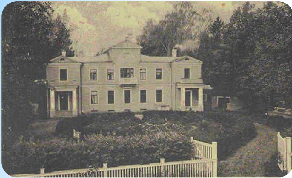
Усадьба Высокое. Д. Эристов