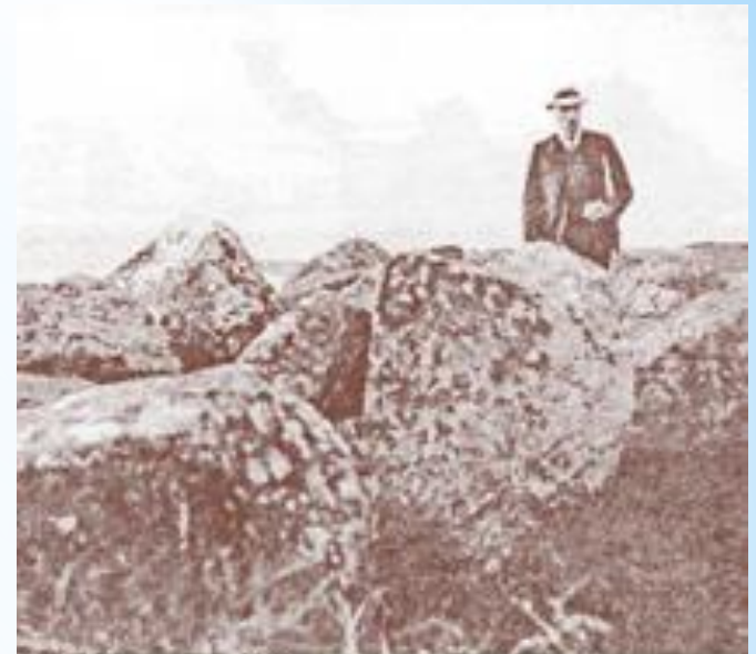
Рерих на озере Пирос (Бологовский район)