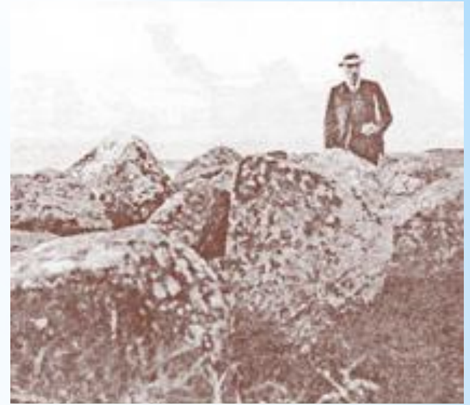
Рерих на озере Пирос (Бологовский район)