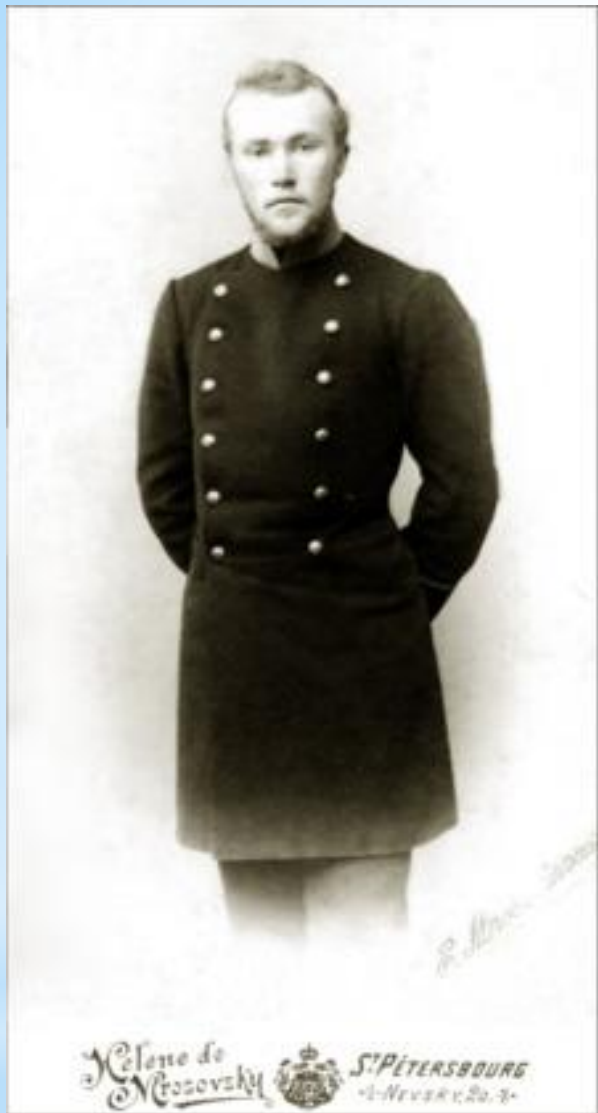
Николай Константинович Рерих