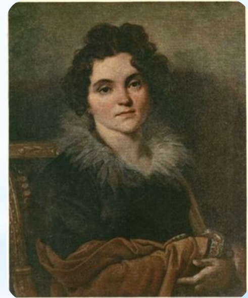
Наталья Дмитриевна Фонвизина