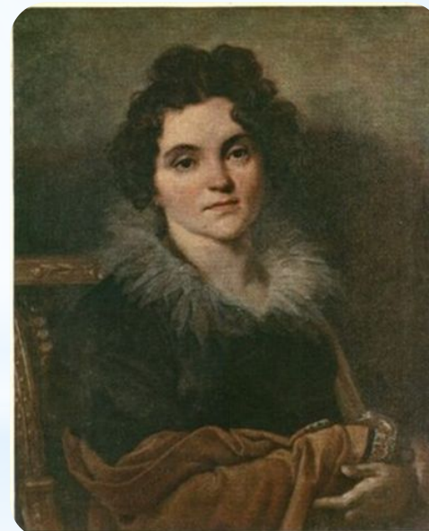
Наталья Дмитриевна Фонвизина