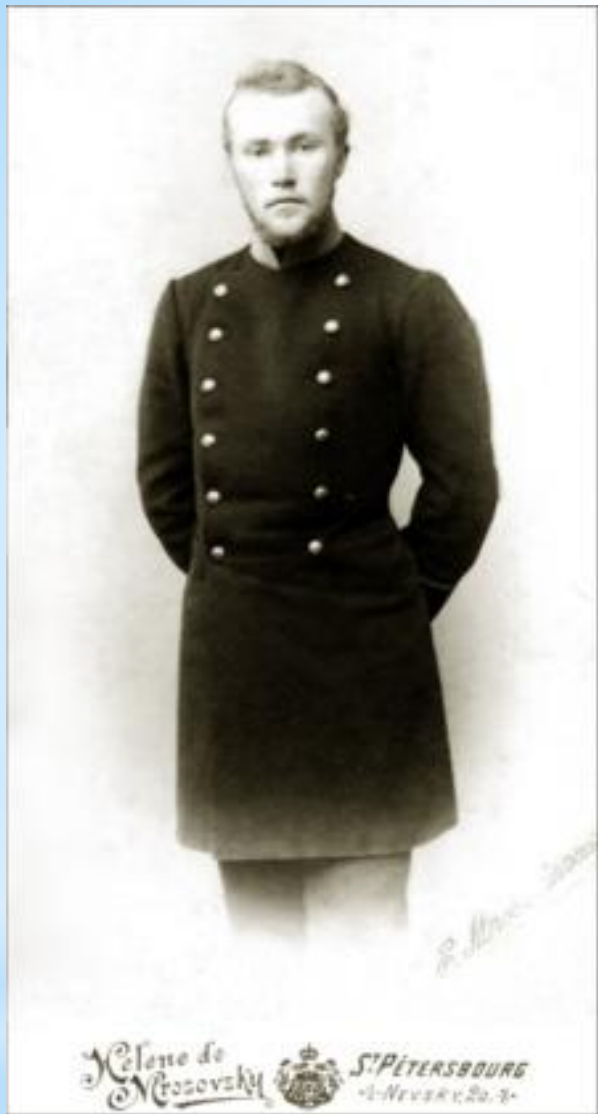
Николай Константинович Рерих