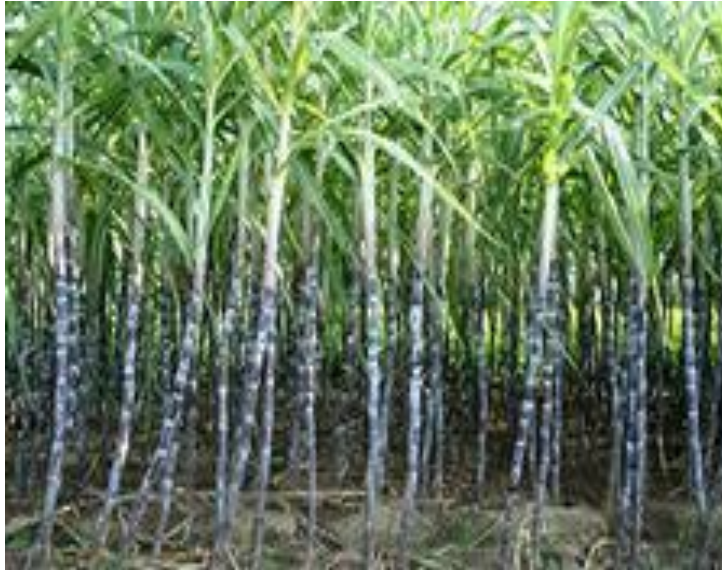
сахарный тростник бамбук