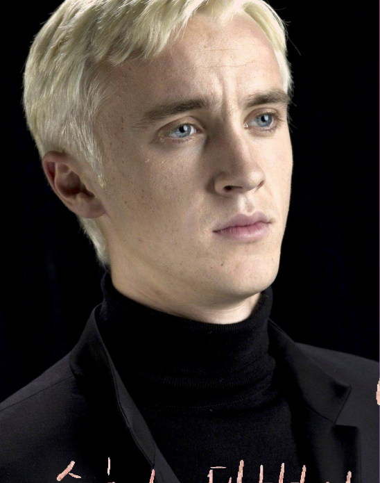
수영 = 대변사