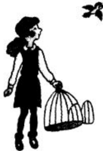
2. I have no bird.