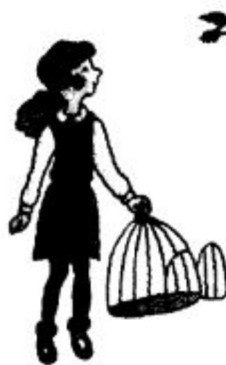
2. I have no bird.