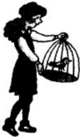
1. I have a bird.

Посмотри на картинки и подписи к ним и реши, как по-английски сказать: «У меня нет (я не имею) ...», «У него нет ...», «У нас нет ...».