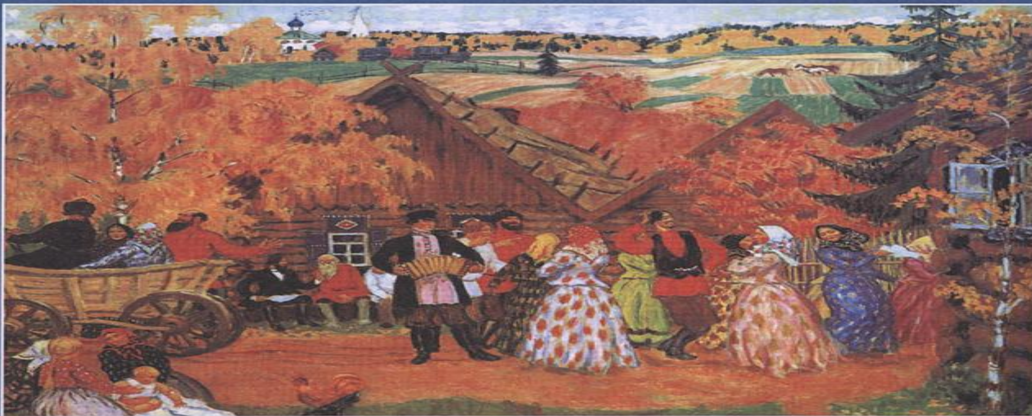
Б. КУСТОДИЕВ. Осенний сельский праздник

14 сентября восточные славяне отмечают праздник, названный в честь Семена Летопроводца. Его суть – проведение торжеств, которые знаменуют приближающуюся осень.