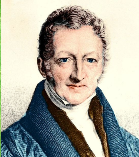
Томас Мальтус (1766—1834)

В 1798 году была опубликована книга Essay on the Principle of Population («Очерк о законе народонаселения»)