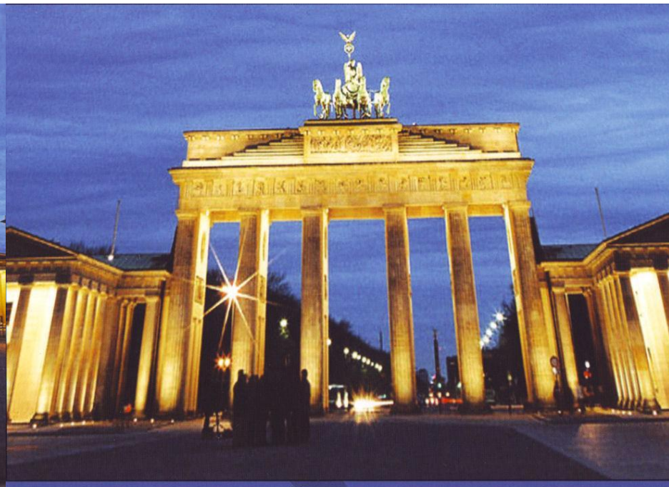
[ ОБРАТНЫЙ АСТИГМАТИЗМ ]