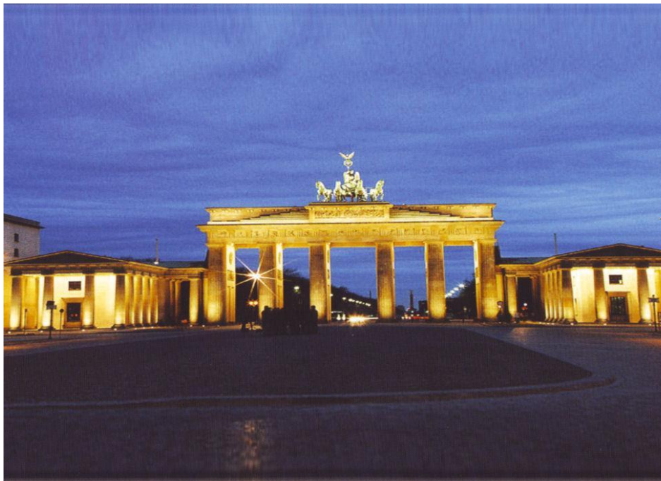
[ ПРЯМОЙ АСТИГМАТИЗМ ]