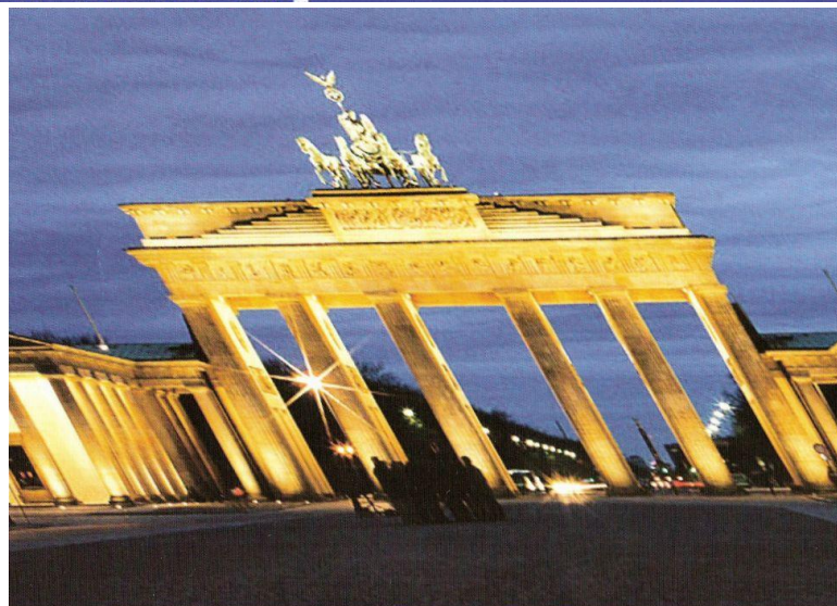
[ АСТИГМАТИЗМ КОСЫХ ПУЧКОВ (КОСОЙ АСТИГМАТИЗМ) ]