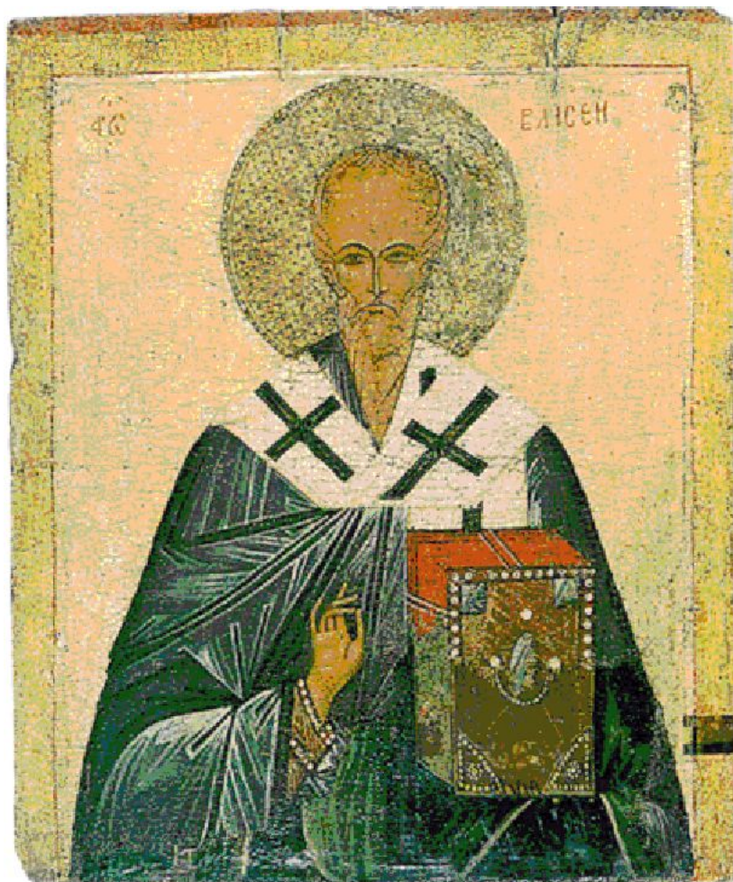
Святой Власий. Конец XV — начало XVI века