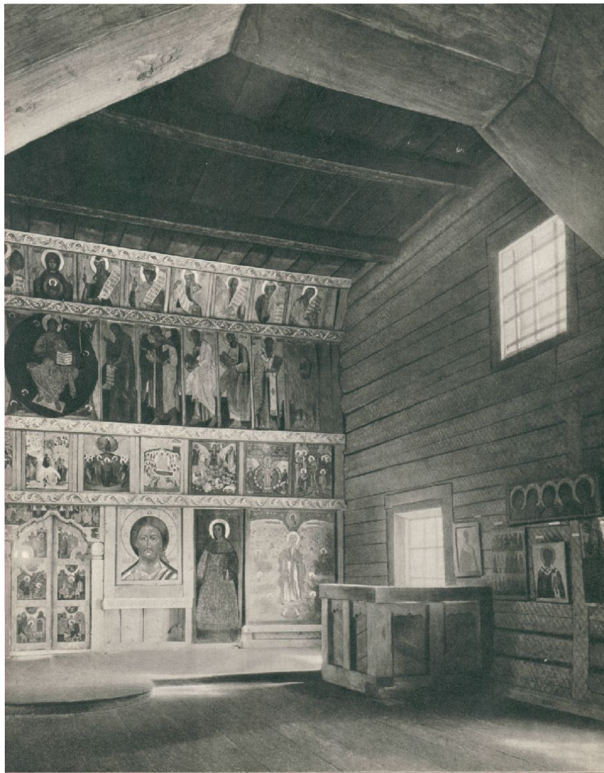
Иконостас Спасо-Преображенского собора Валаамского монастыря.

Иконостас северной деревянной церкви был устроен своеобразно.