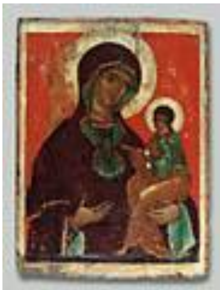
"Богоматерь с Младенцем" из деревни Усть-Колода (Кубово),

В иконах XV - первой половины XVI вв. - искусство Великого Новгорода и его традиции определяли становление и развитие иконописи