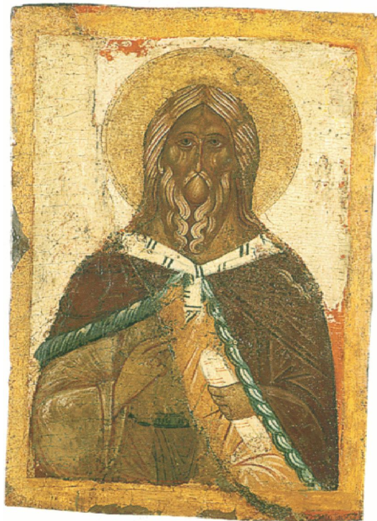
Пророк Илья. Первая половина XV века Новгород, северная провинция.

Но затерянные в северной тайге церкви и жилища долго не могли похвастаться иконами, написанными в больших городах и художественных центрах России. Поэтому в Карелии появляются свои, деревенские живописцы. Они не могли на равных состязаться с утонченным стилем новгородской школы второй половины 14 в., но по-своему раскрывали сюжет, передавали чувства персонажей.