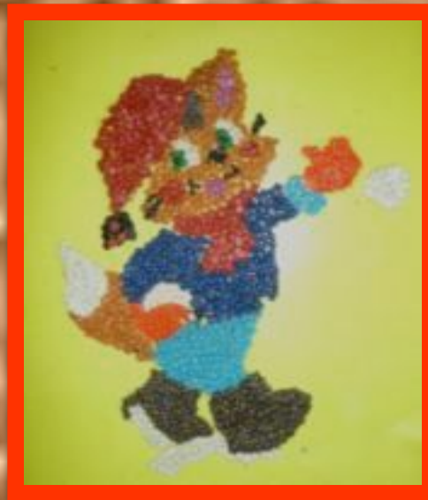
Мозаика из пластилина