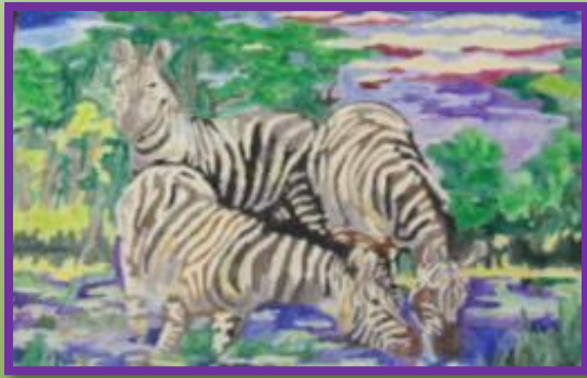
работы Курбатовой Светланы 12 лет

Само слово «живопись» означает – «писать жизнь». Живописью называют и само произведение выполненное красками – такие сведения получают учащиеся 4 классов и выполняют вот такие работы .