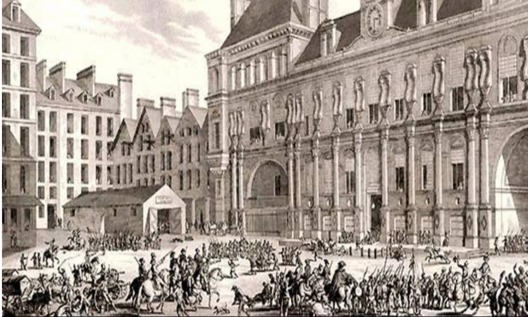
Подавление восстания в центре Парижа.

Термидорианцы – люди, пришедшие к власти 9 термидора, стояли за республику, собственность и свободу предпринимательства.