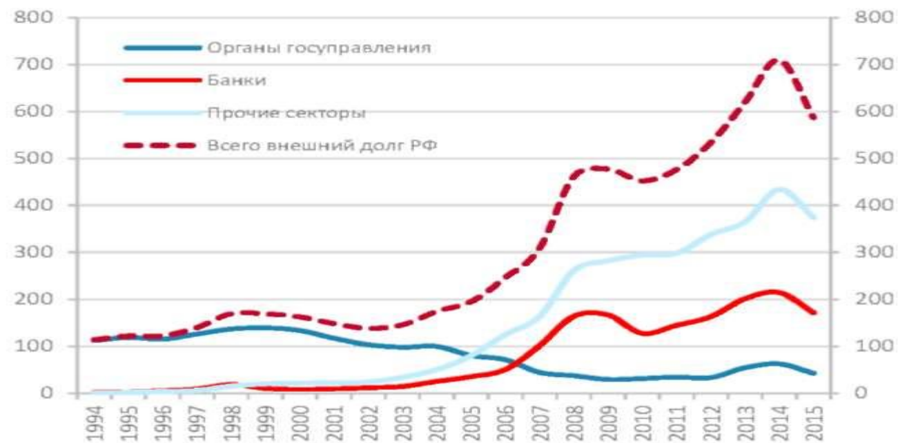
График 2. Объем внешнего долга по группам заемщиков, $ млрд.