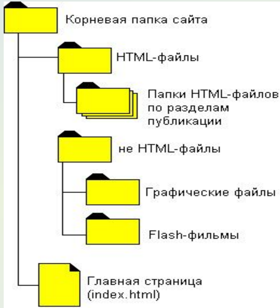
Рис.1 Стандартная структура сайта (без CSS)