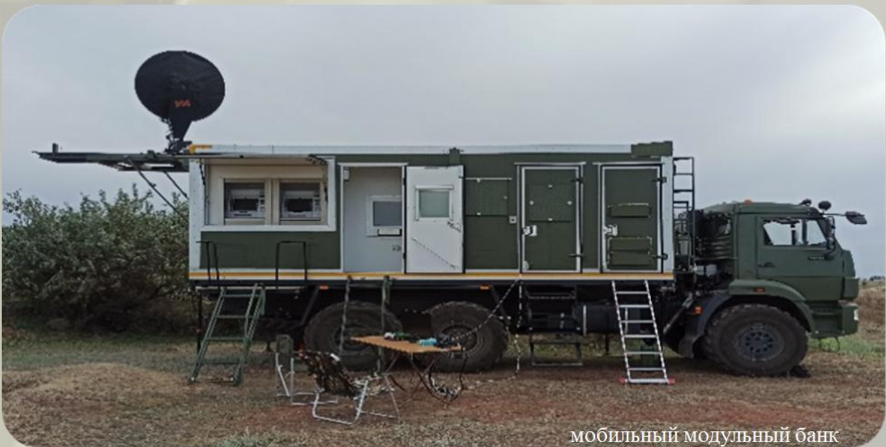
мобильный модульный банк