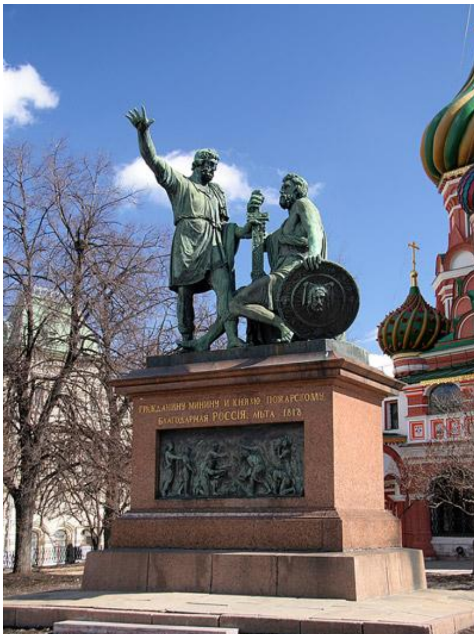
Памятник Минину и Пожарскому —Скульптор И. Мартос, 1812—1818 гг. расположена перед Собором Василия Блаженного на Красной площади в Москве