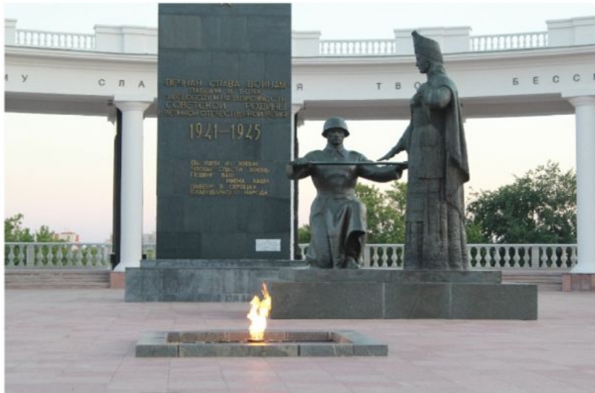
Вечный огонь г. Саранск

ВЕЧНЫЙ ОГОНЬ – символ памяти о павших героях, их подвигах, жертвах фашизма. Во многих городах нашей страны есть памятники погибшим воинам с Вечным огнем. Есть такой памятник и в столице Мордовии городе Саранске.