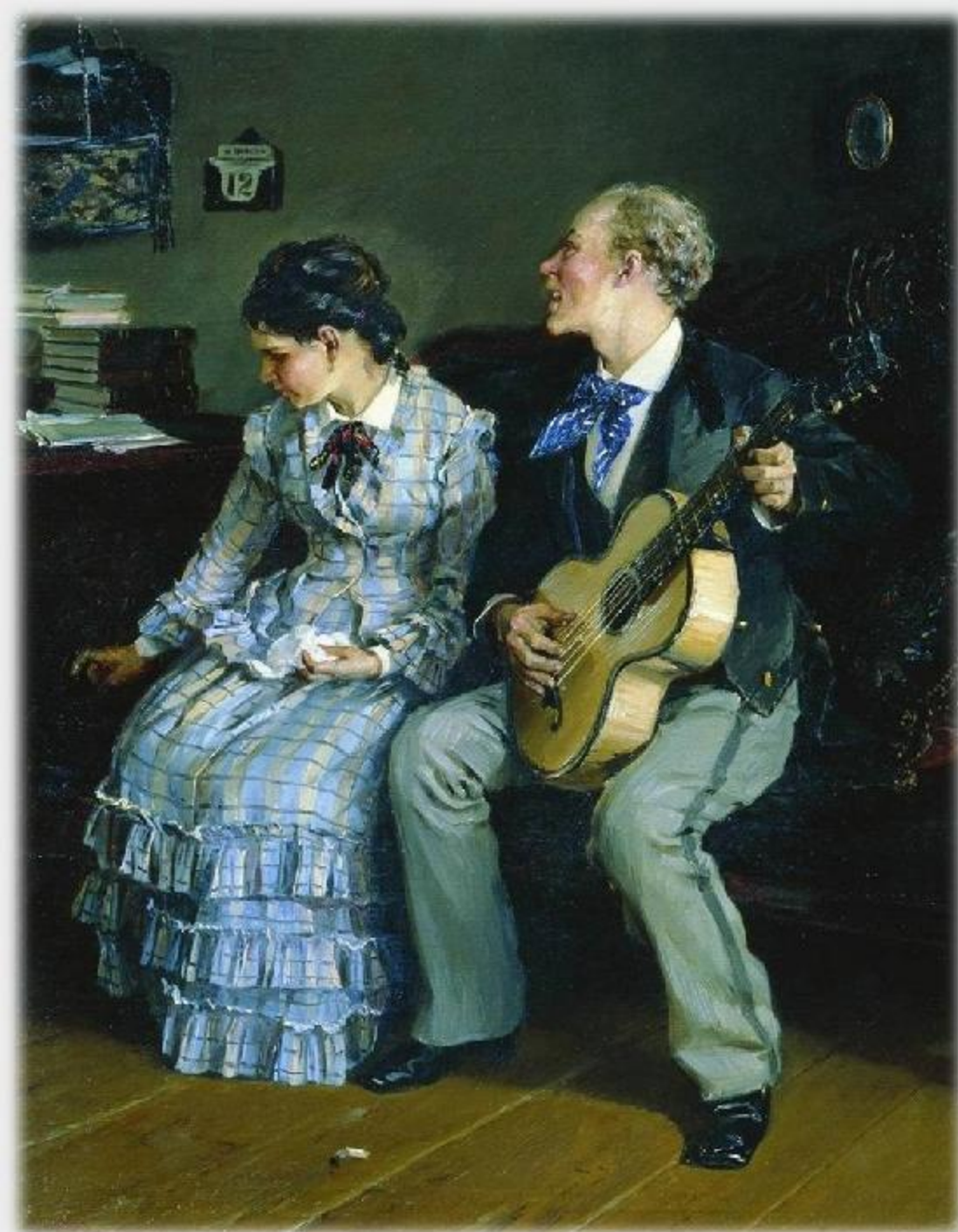
И. Прянишников «Жестокие романсы»