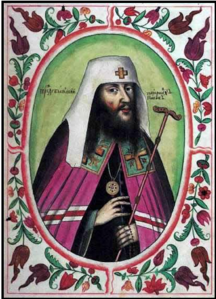
▶ Патриарх Никон