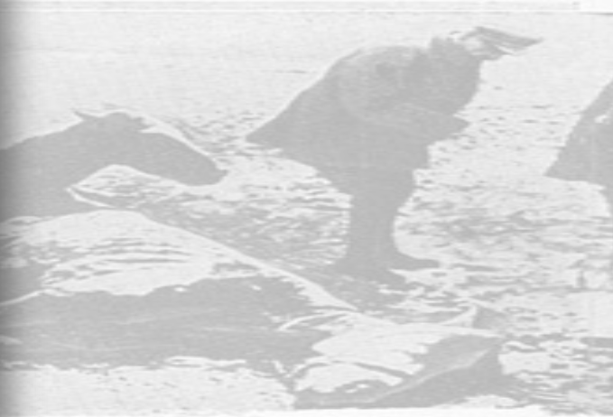
Two millions died in a few years. Millions more lie dead, awaiting the few weeks' respite. Peasants begged food for their livestock were driven off by armed soldiers.