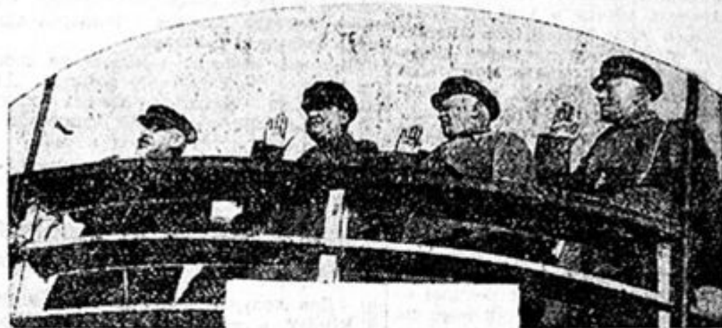
Члены политбюро ЦК КП(б)У и правительства приветствуют колонны демонстрантов.

По окончании парада войск, начинается демонстрация трудящихся Харькова. Открывает демонстрацию колонна авто-