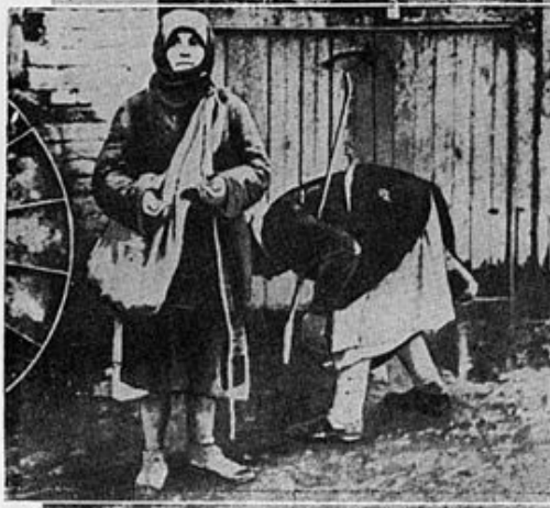
Like harvest food, two peasant women gather kernels of grain spilled in sowing. They must do this to keep alive in a land of plenty—the Ukraine.