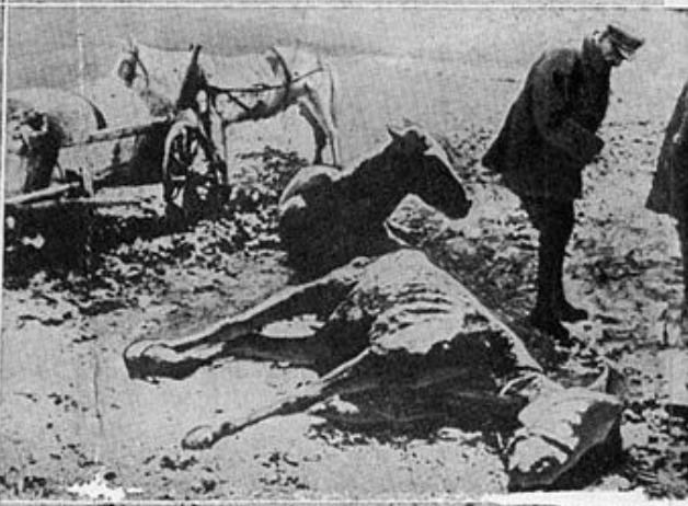
Russia's beautiful thoroughbred horses, known the world over, are used now in the agricultural districts. The animals, needed on every farm, are dying off by the millions of starvation.