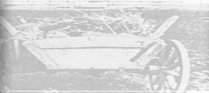
Food Hunter Shot. (Red Bullets Fly)

The peasants were searching for grain in a field. They were unable to find any, and their horses were dying. They were unable to feed themselves and their livestock through the winter.