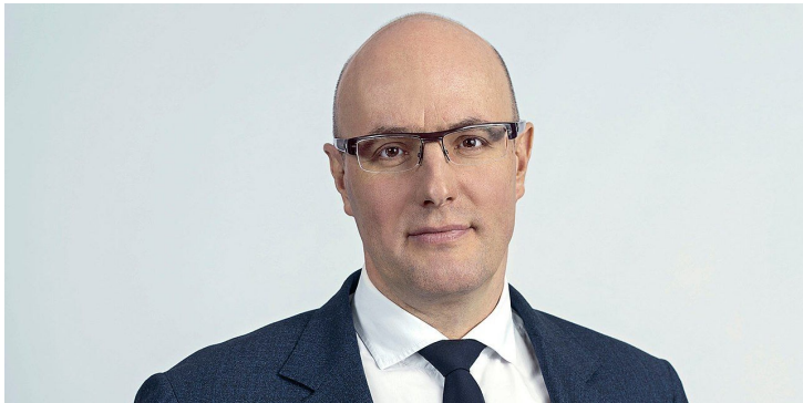
Дмитрий Чернышенко (с 2020 года)