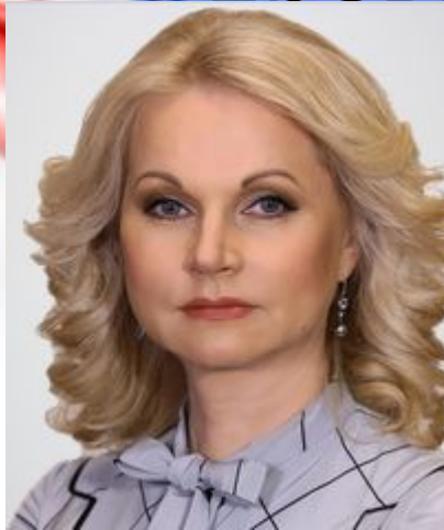
Татьяна Голикова (с 2018 года)