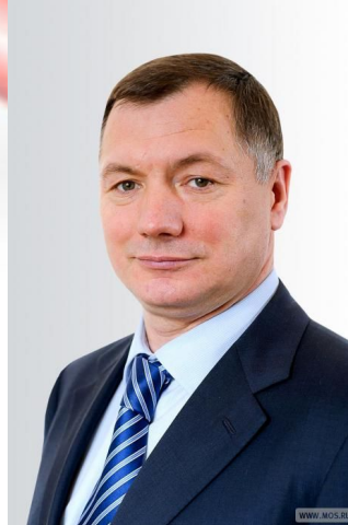
Марат Хуснуллин (с 2020 года)