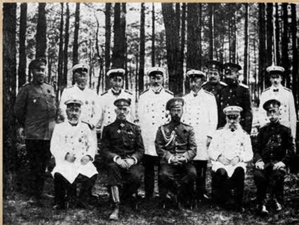
Совет министров Российской империи. 1915 г.