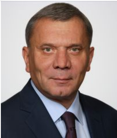
Юрий Борисов (с 2018 года)