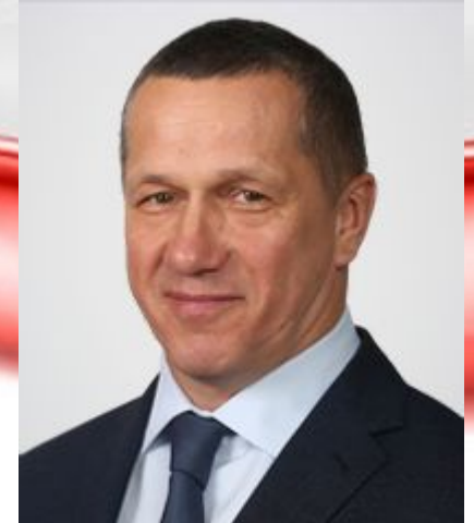
Юрий Трутнев (с 2013 года)