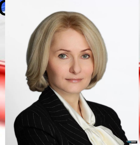
Виктория Абрамченко (с 2020 года)