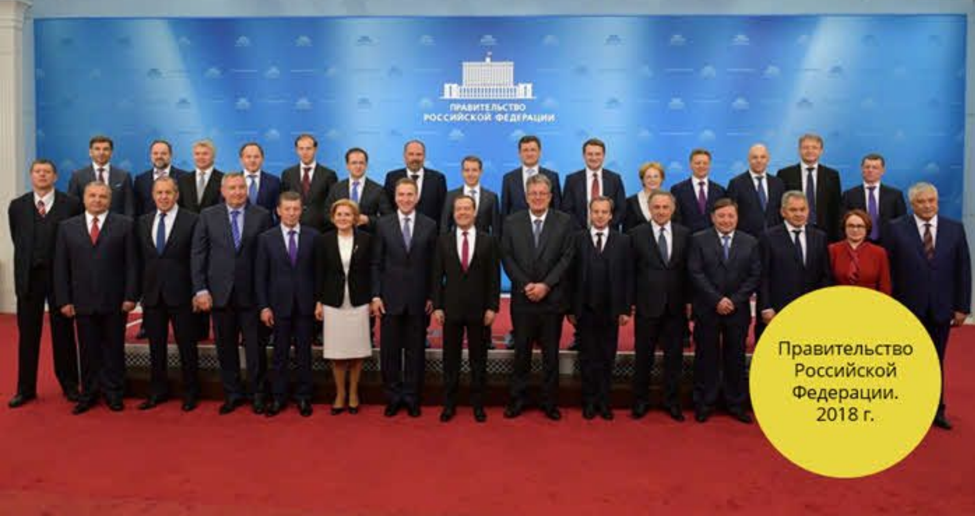
Правительство Российской Федерации. 2018 г.