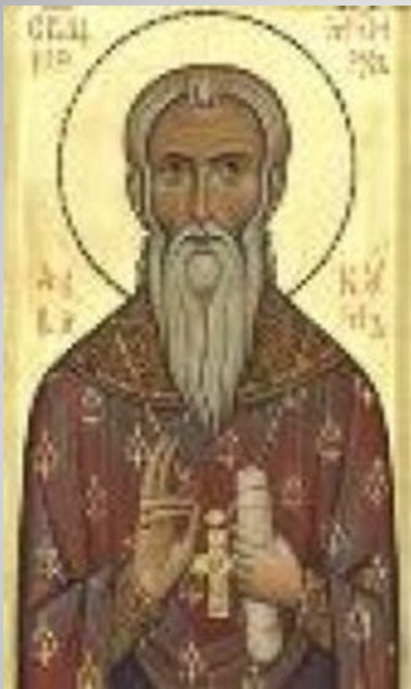
Протопоп Аввакум (1620/21-1682)