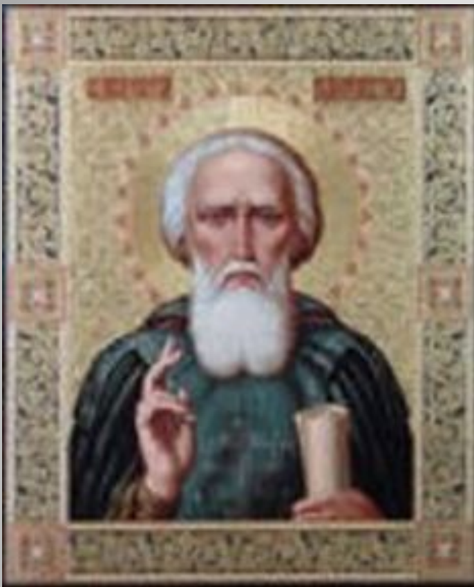
Сергий Радонежский (1321-1391)