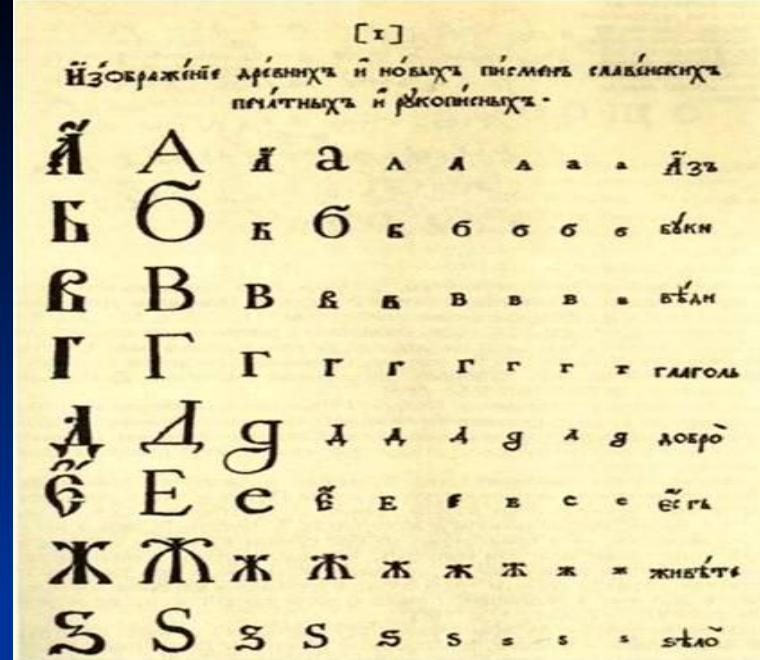
Гражданская азбука при Петре I