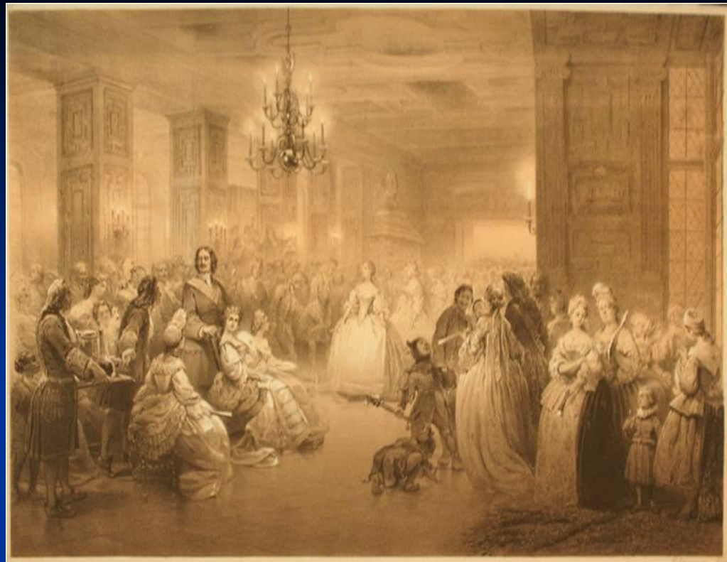
Ассамблея при Петре I

Въ первыхъ наипаче всего должны дѣти отца и ма- терь въ великой чести содержать. И когда отъ родителей что имъ пріказано бы- ваетъ, всегда шляпу въ рукахъ держатъ, а предъ ними не вѣдвоятъ, и возлѣ ихъ не садятся; и прежде оныхъ не засѣдаютъ, при нихъ во окно всѣмъ тѣломъ не выглядывать, но все попеннымъ образомъ А съ великимъ