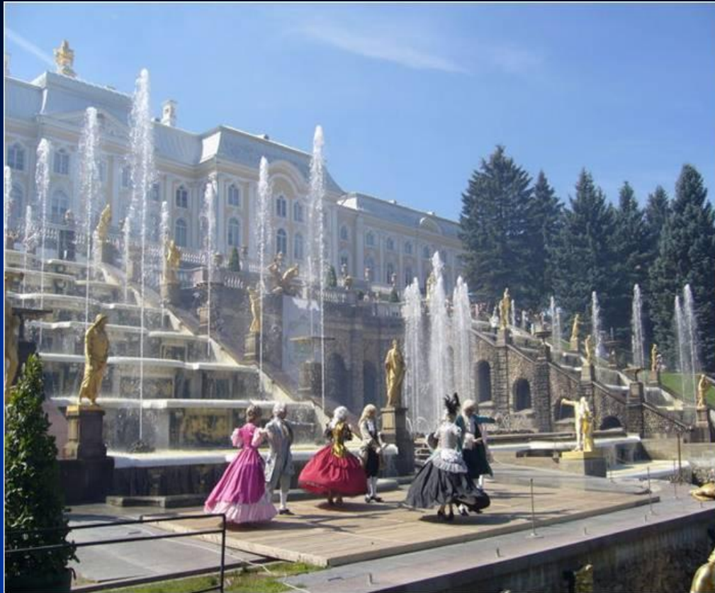
Сооружение императорского дворцового ансамбля в Петегорфе