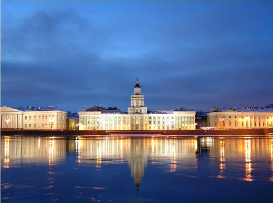
Здание Кунсткамеры в Петербурге