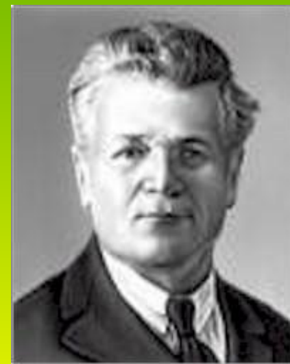
Шацкий Станислав Теофилович

1905 год – внедрение метода проектов в образовательный процесс в России.