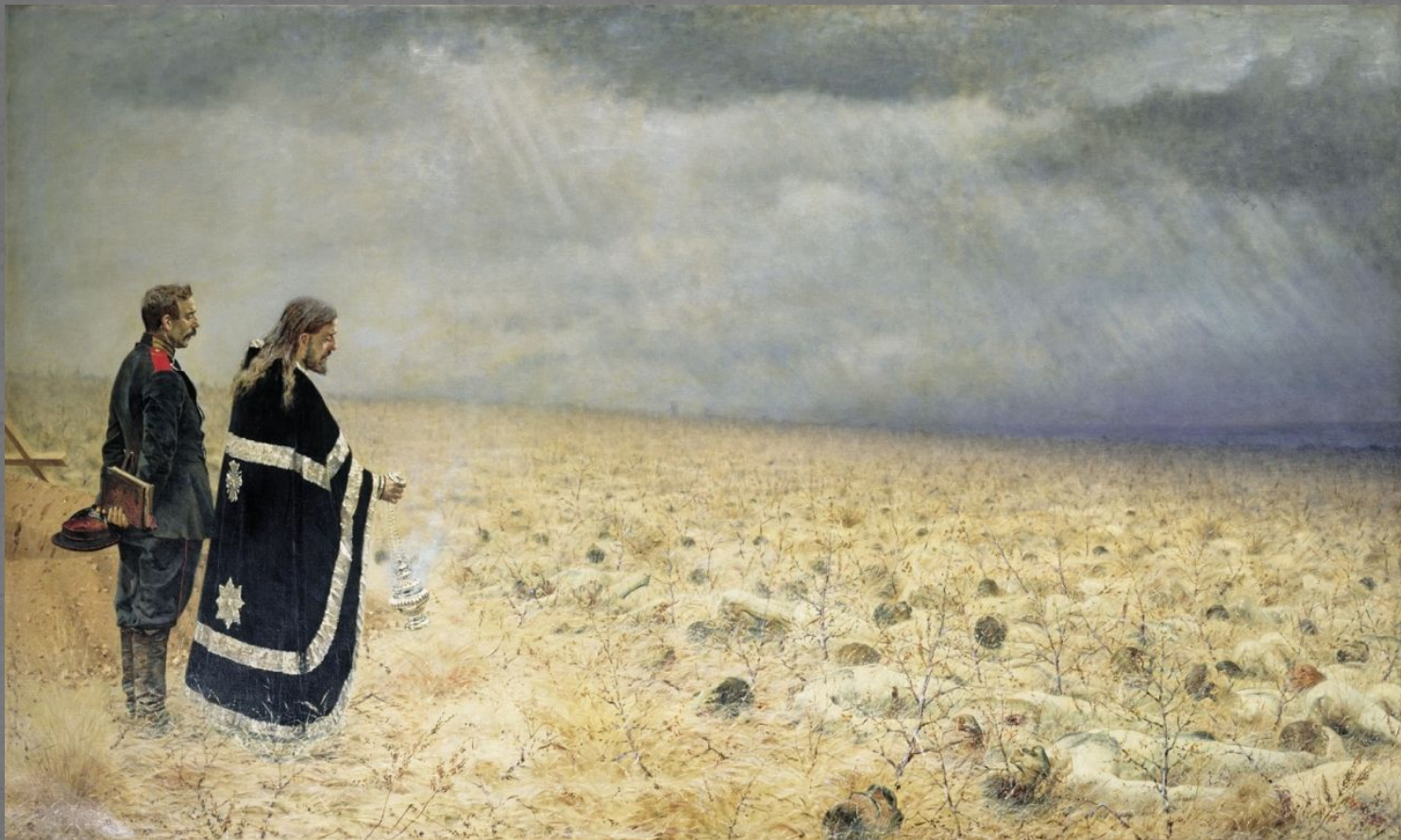
В. Верещагин «Побежденные. Панихида»