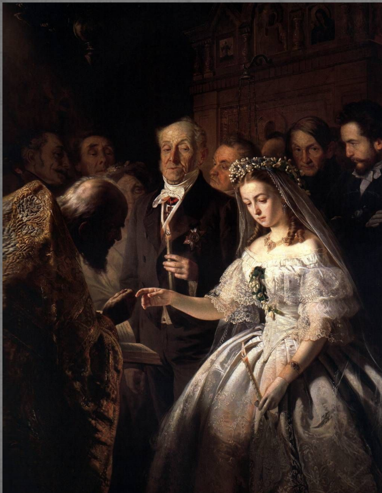
В. Пукирев «Неравный брак»