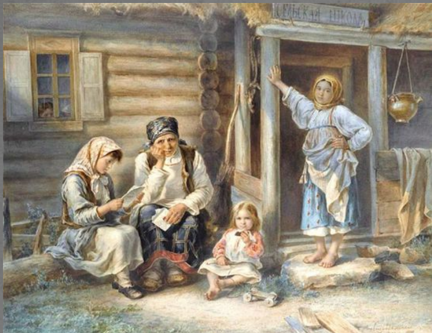
А. Стрелковский «Сельская школа»