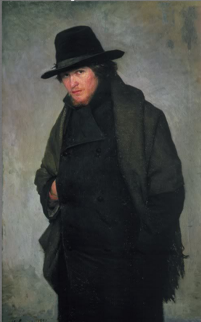
Н. Ярошенко «Студент»