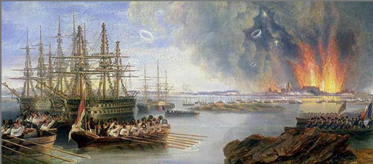
Джон Уилсон Кармайкл «Бомбардировка Севастополя»