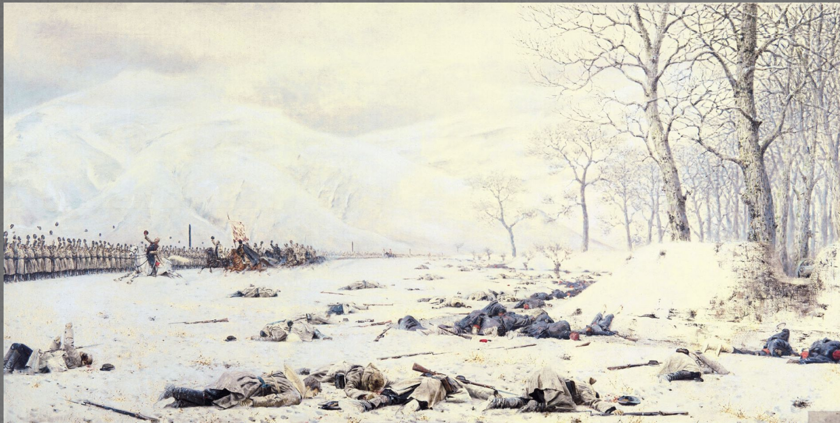
Верещагин «Скобелев под Шипкой»