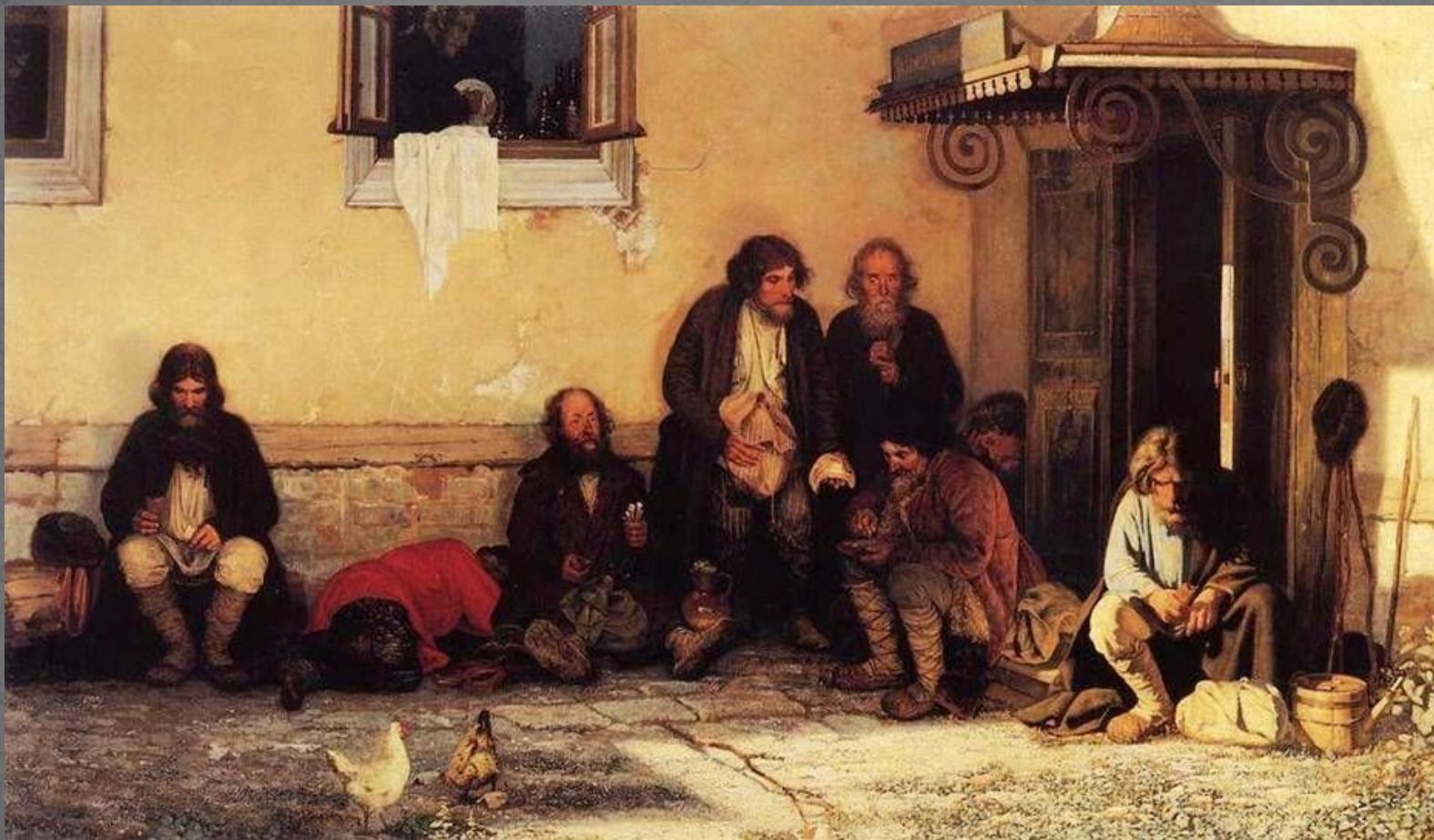
Г. Мясоедов «Земство обедает»