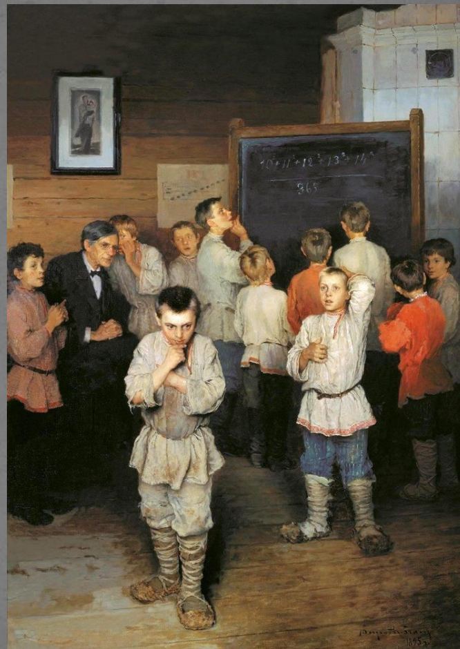
Богданов-Бельский «Устный счет»