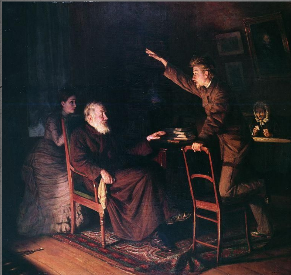
Н. Ярошенко «Старое и молодое»

Сыновья священников бросали семинарии, сыновья разночинцев обвиняли отцов в постыдном смирении, сыновья купцов отказывались жить по «Домострою», сыновья чиновников называли отцов взяточниками и казнокрадами, сыновья помещиков обвиняли отцов в бесчеловечности к крепостным.