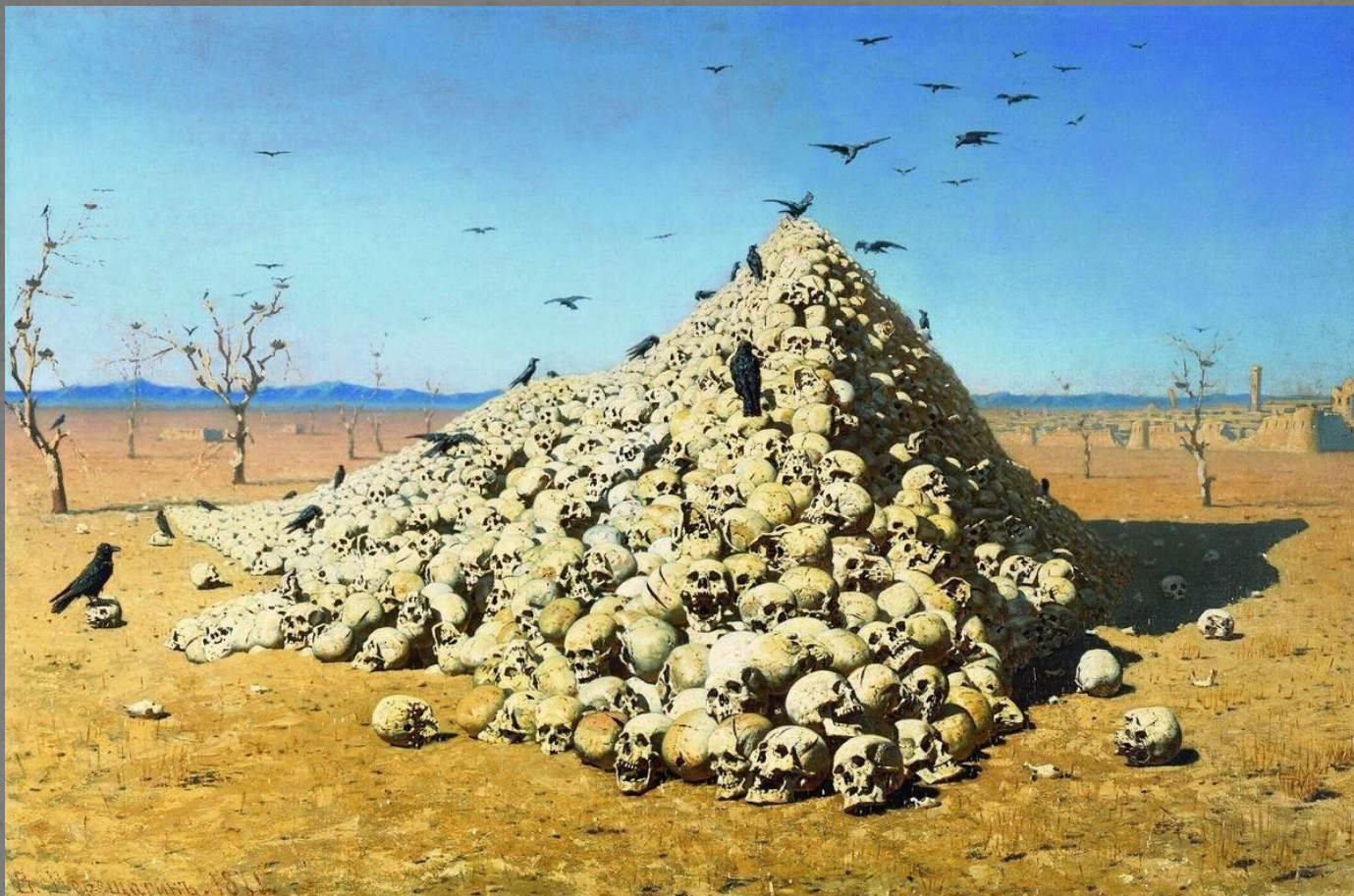
В. Верещагин «Апофеоз войны»