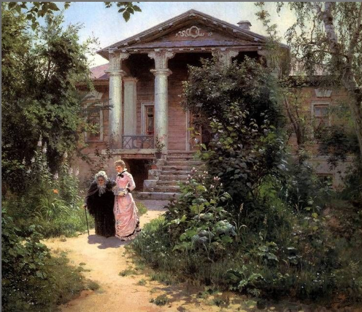
В. Поленов «Бабушкин сад»