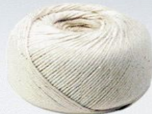
one yard string