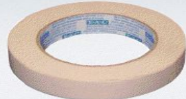
one yard tape