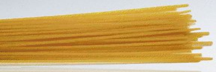
20 sticks of spaghetti