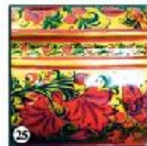
Зеленый фон "Птицы в клетках"