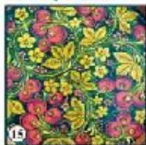
Чёрный фон "Виноград"