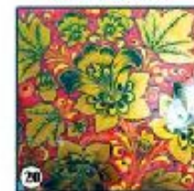
Красный фон "Цветы"