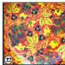
Красный фон "Ягоды"