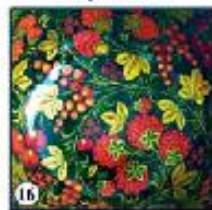
Чёрный фон Ягоды "Изобилие"