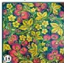
Чёрный фон "Виноград"