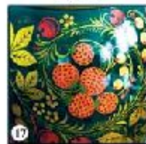
Чёрный фон "Ежевика"