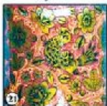
Красный фон "Птицы в цветах"