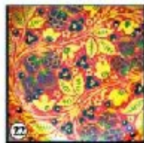
Красный фон "Ягоды"