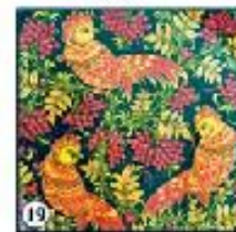
Чёрный фон "Птицы в клетках"