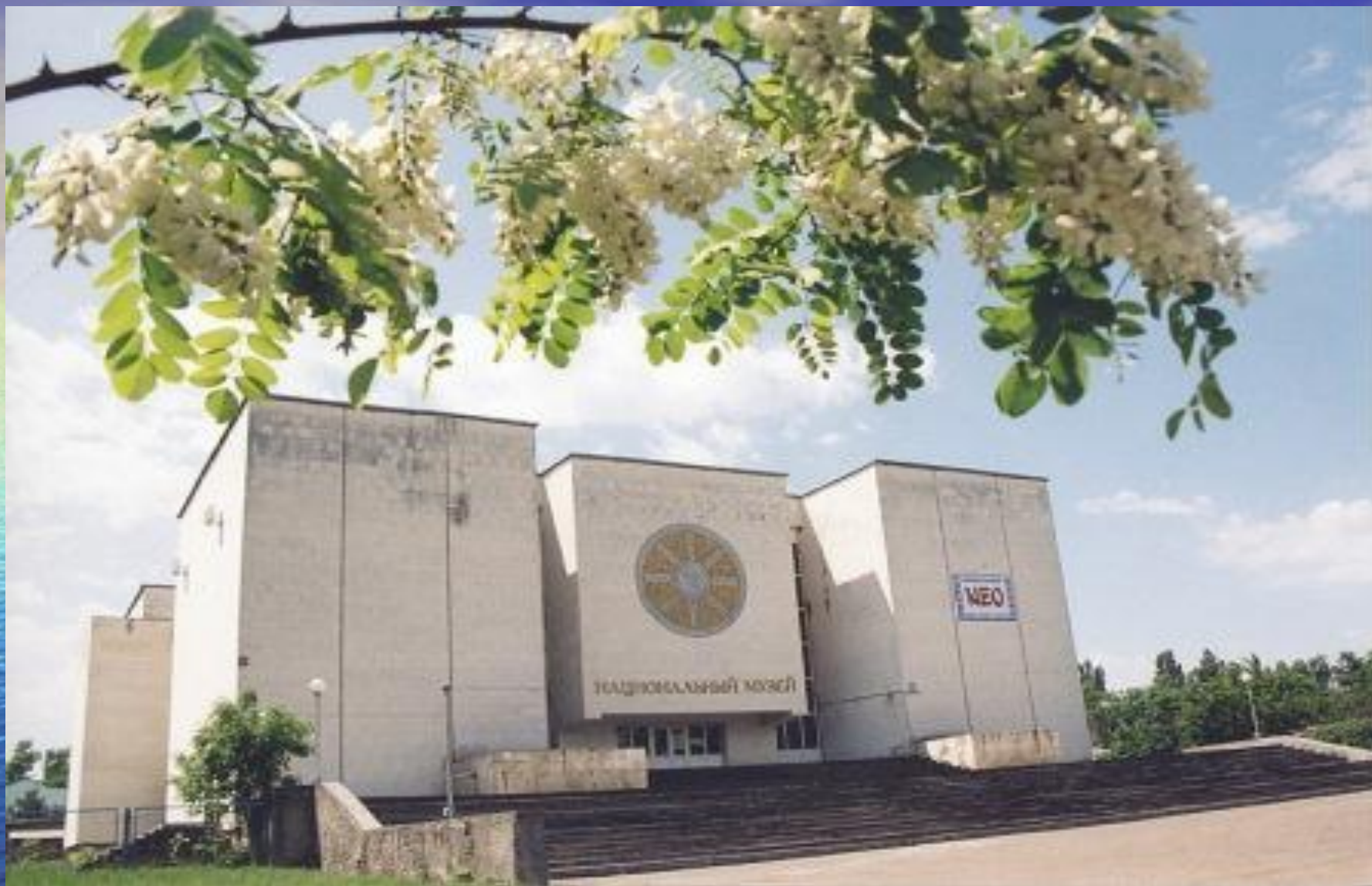
Национальный музей Республики Адыгея