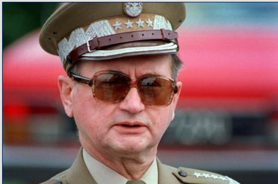
Генерал Войцех Ярузельский, введший в Польше ЧП и правившей ею с 1981 по 1990 г.