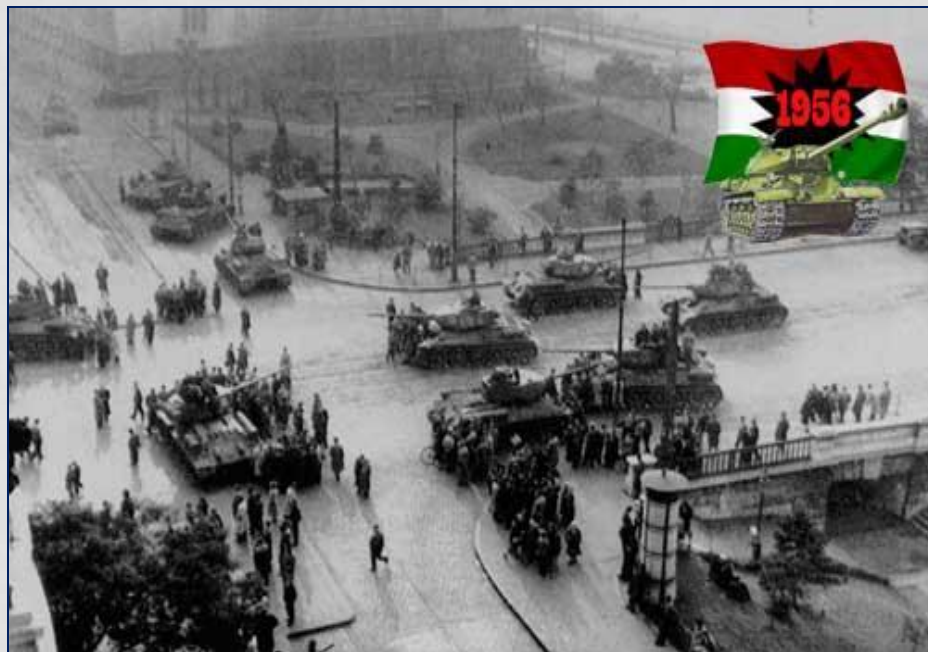
Венгрия. 1956 г.