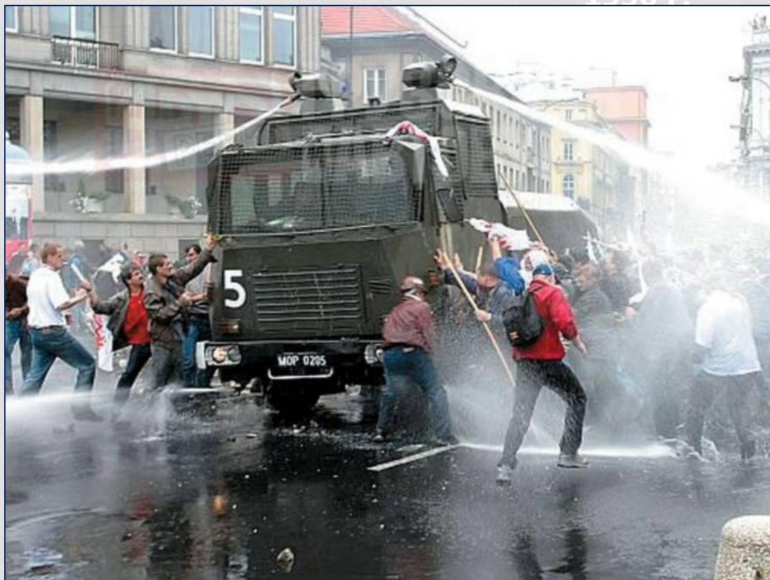
Польша. 1990 г.