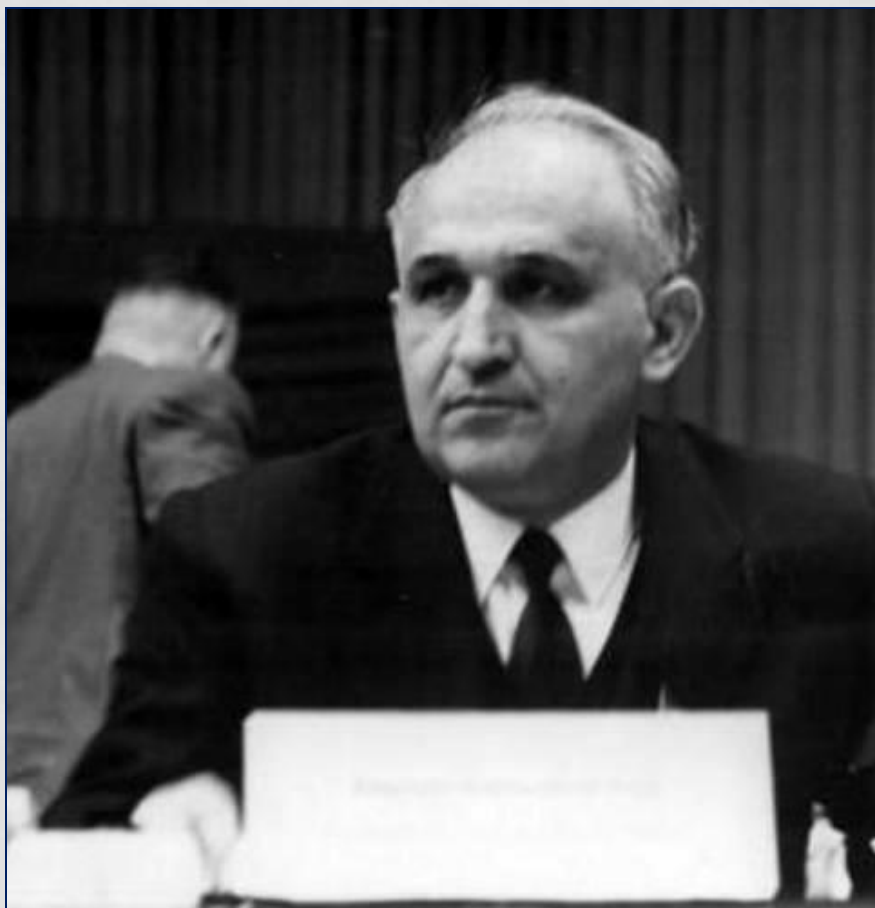
«Отец всех болгар» Тодор Живков. Правитель Болгарии с 1954 по 1989 гг.

«Реальный социализм» оказался тупиковой ветвью развития. К концу 80-х гг. в связи с перестройкой в СССР в странах Восточной Европы проходят «бархатные революции» свергающие коммунистические правительства.