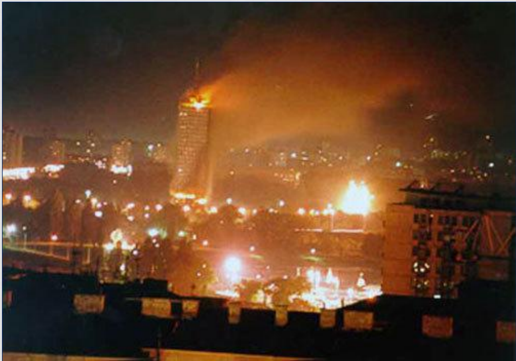
Воздушный удар авиации НАТО по Белграду, столице Югославии. 1998 г.