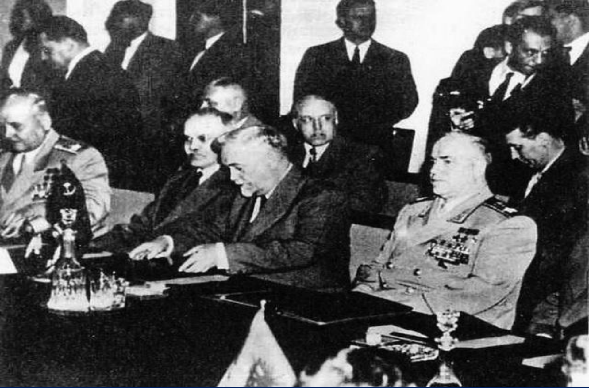
Подписание договора об образовании ОВД. 1955 г.