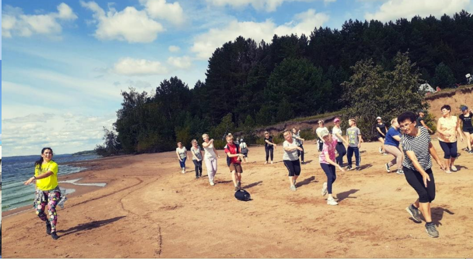
В день физкультурника— поход на теплоходе за Каму