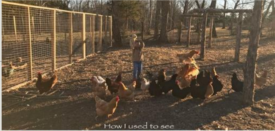
How I used to see