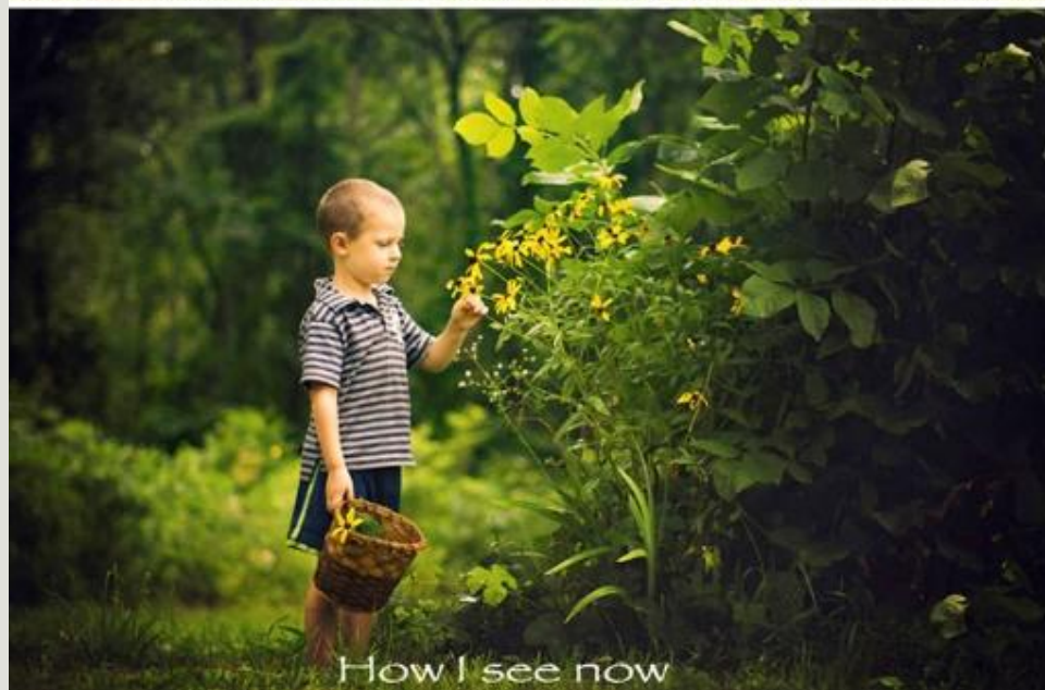
How I see now