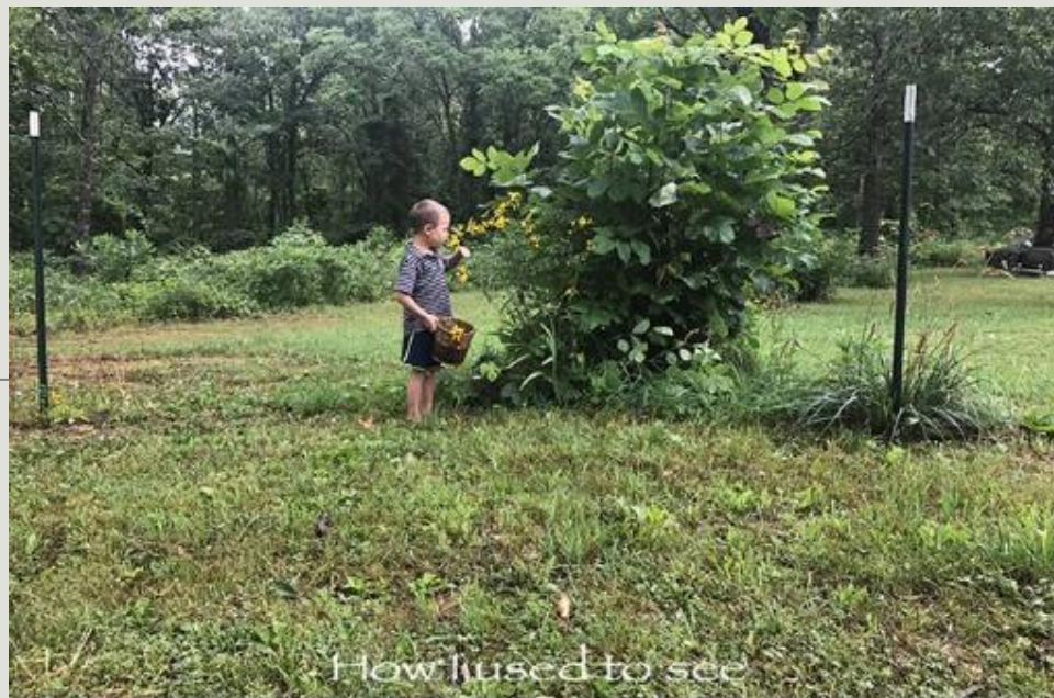
How I used to see