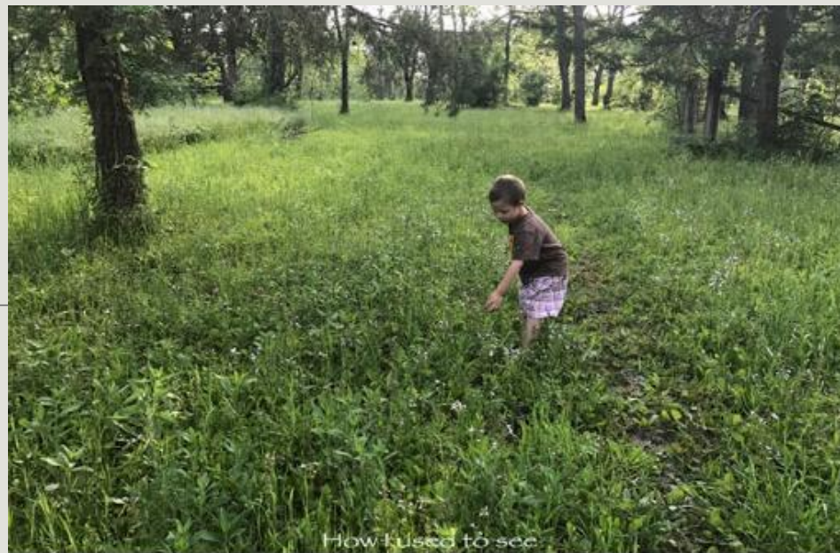
How I used to see