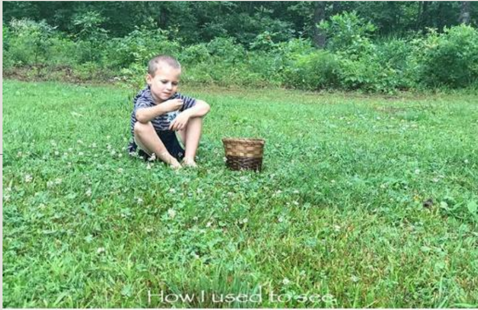
How I used to see.