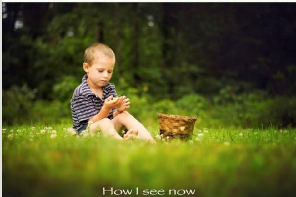
How I see now