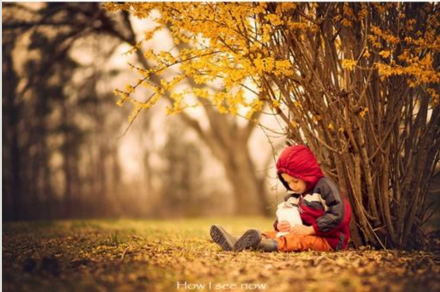
How I see now