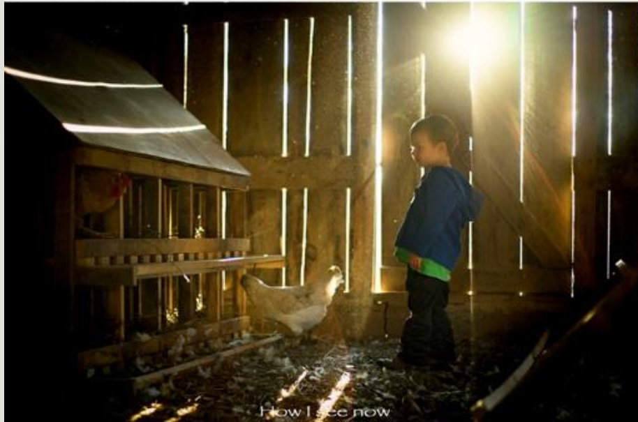
How I see now