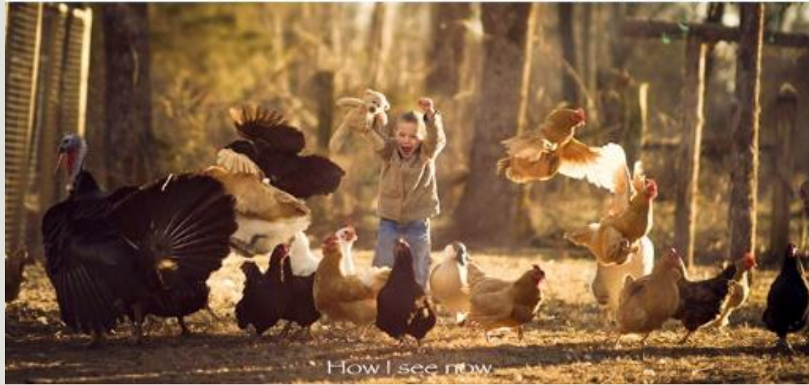
How I see now