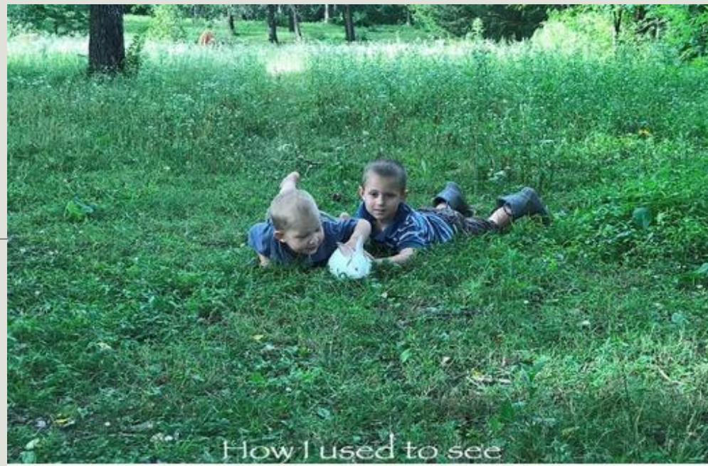
How I used to see