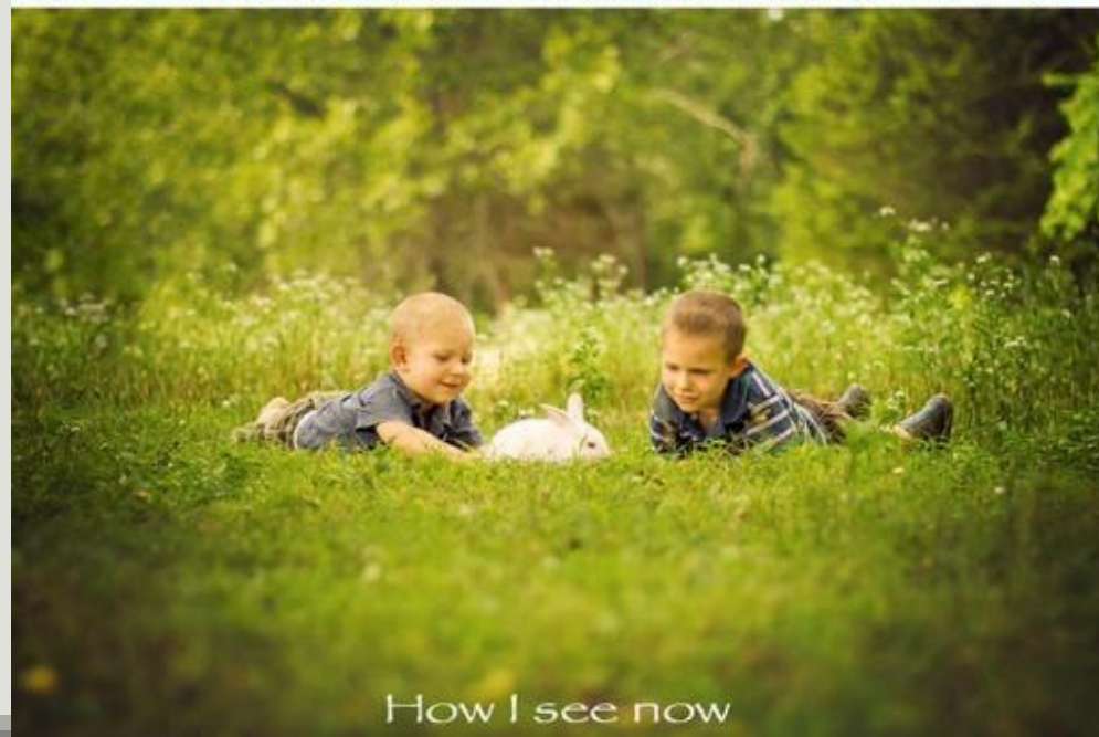
How I see now