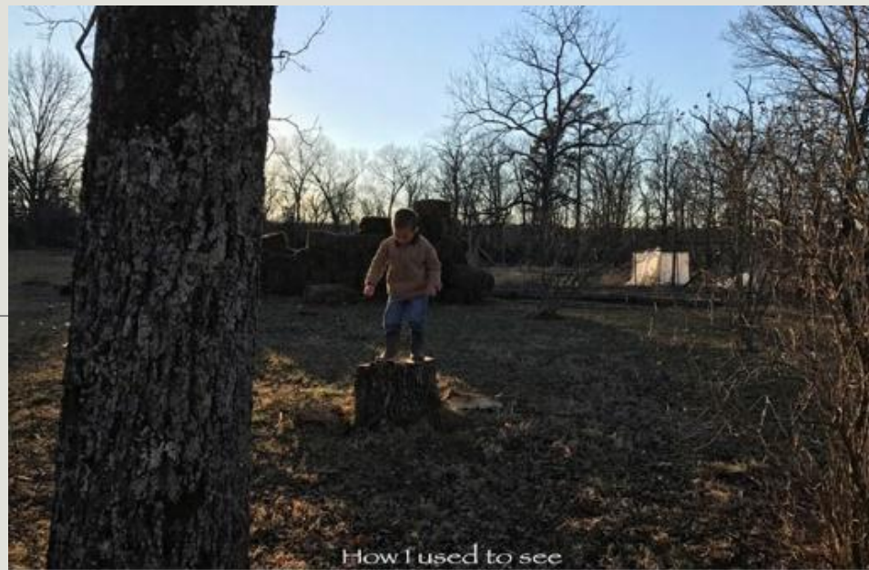
How I used to see