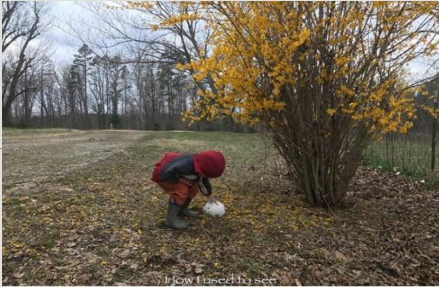
How I used to see