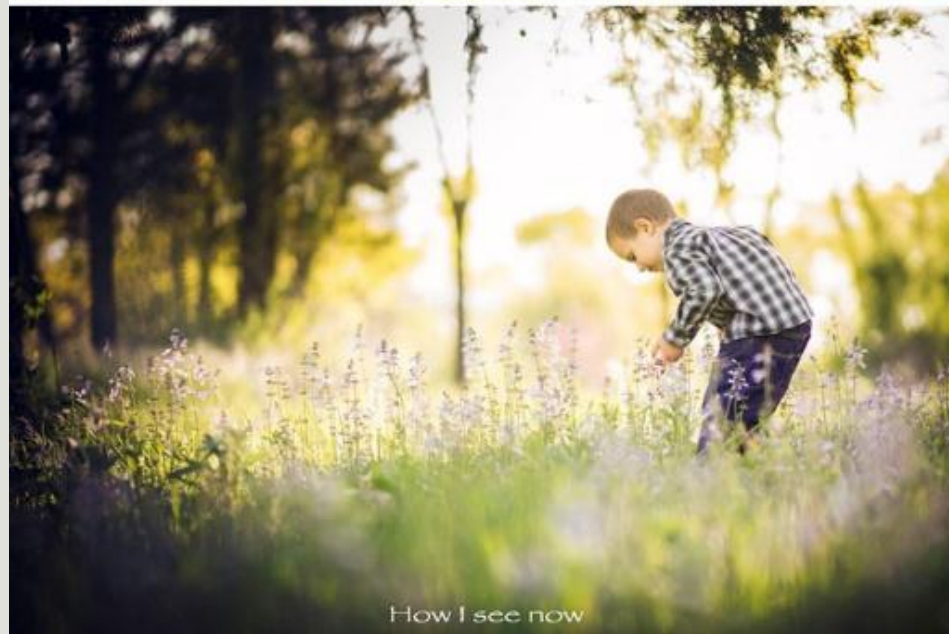
How I see now