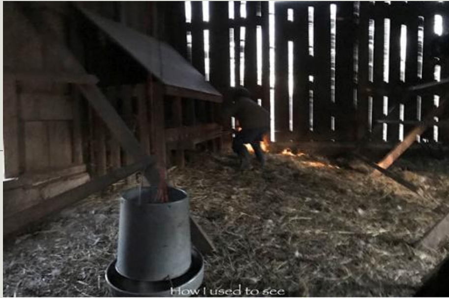
How I used to see