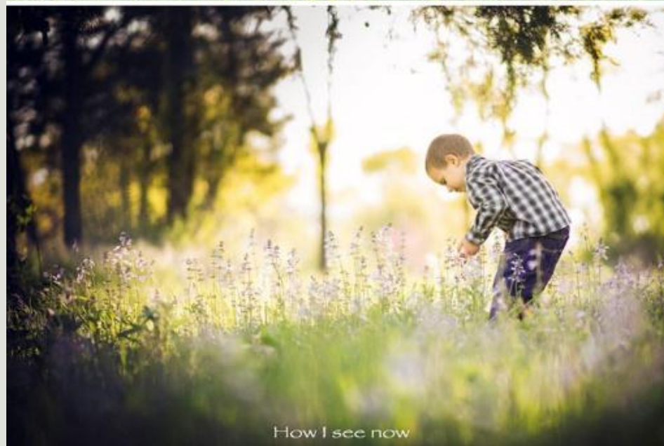
How I see now