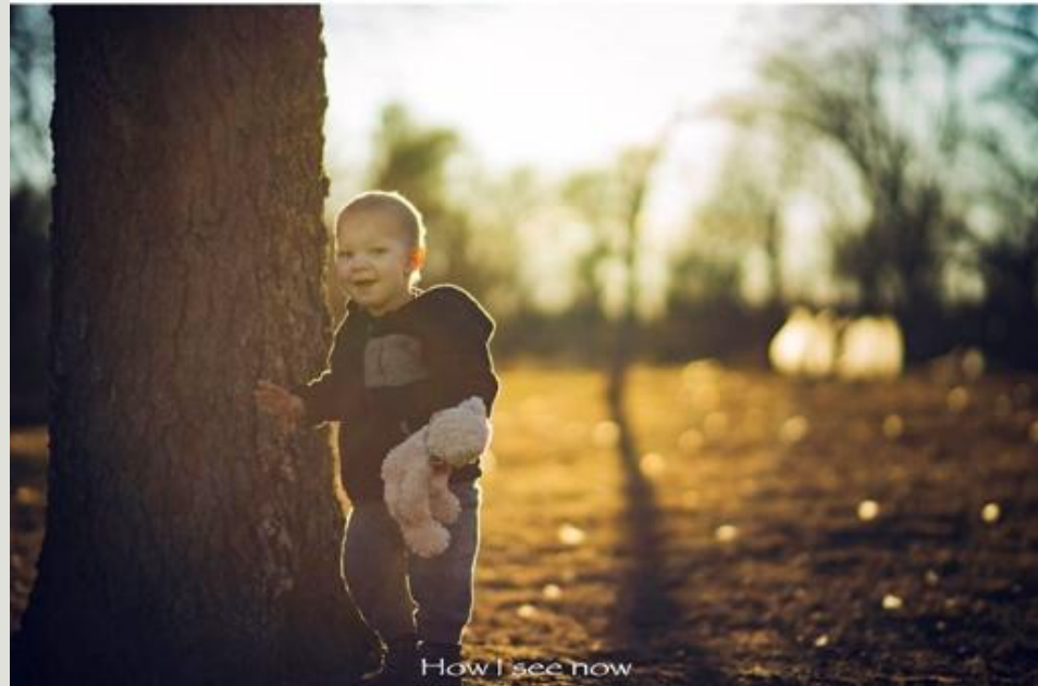
How I see now A solid teal-colored horizontal bar at the bottom of the page.