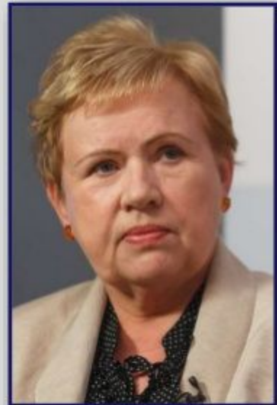
Председатель Центральной комиссии Республики Беларусь по выборам и проведению республиканских референдумов Л.М.Ермошина