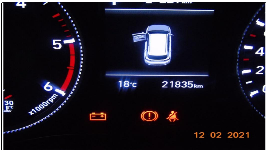
дефект и пробег