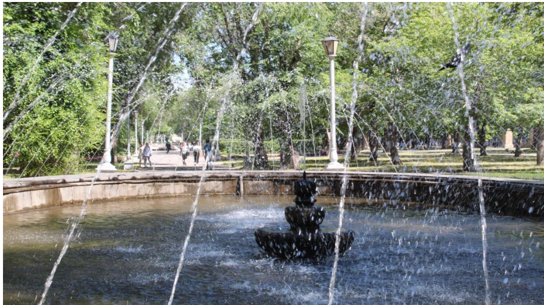
Фото.1 и 2

В Парк расположен напротив Горного университета, проспект — визитная карточка города, символ Магнитогорска и место, которое нужно обязательно увидеть своими глазами. Украшением парка Metallургов служат фонтаны.