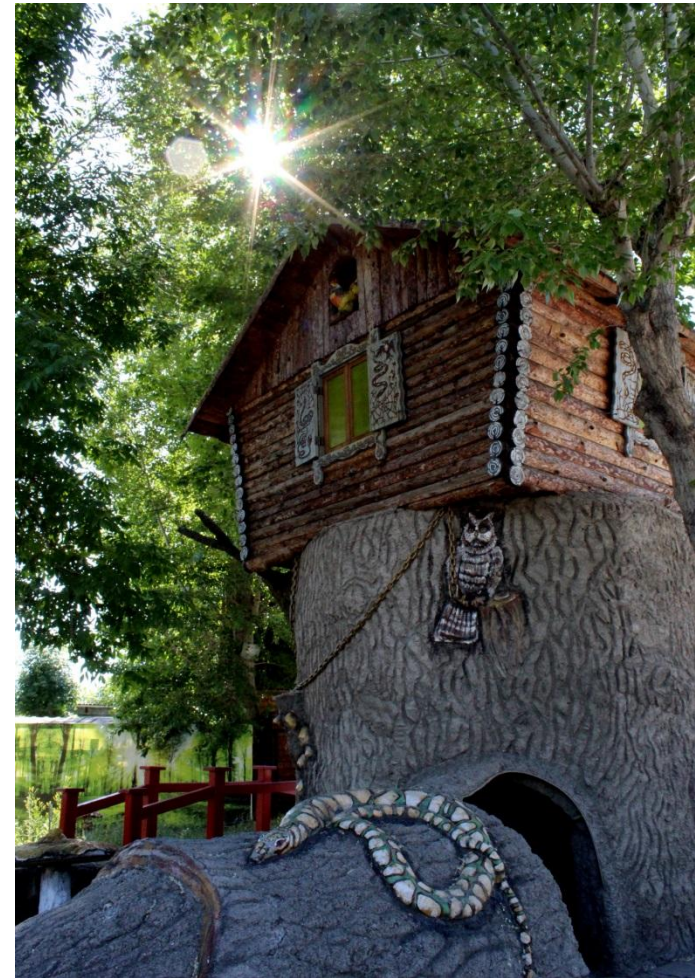
Фото.3 и 4 «Зеленый дуб и золотая цепь»