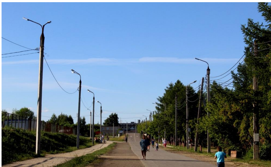
Фото.1 и 2 «Дорожка для бегунов»

Это настоящий природный оазис, ставший любимым местом отдыха жителей Магнитогорска.