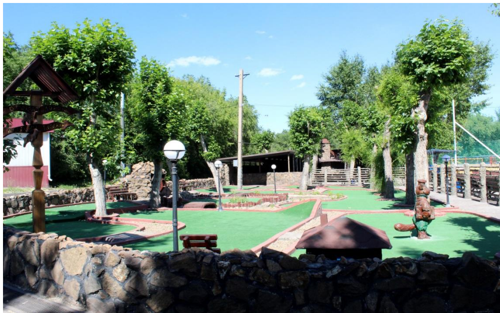
Фото.5 «Зона для мини-гольфа»

Имеется многое для отдыха детей в виде детского городка, батутов и тира.