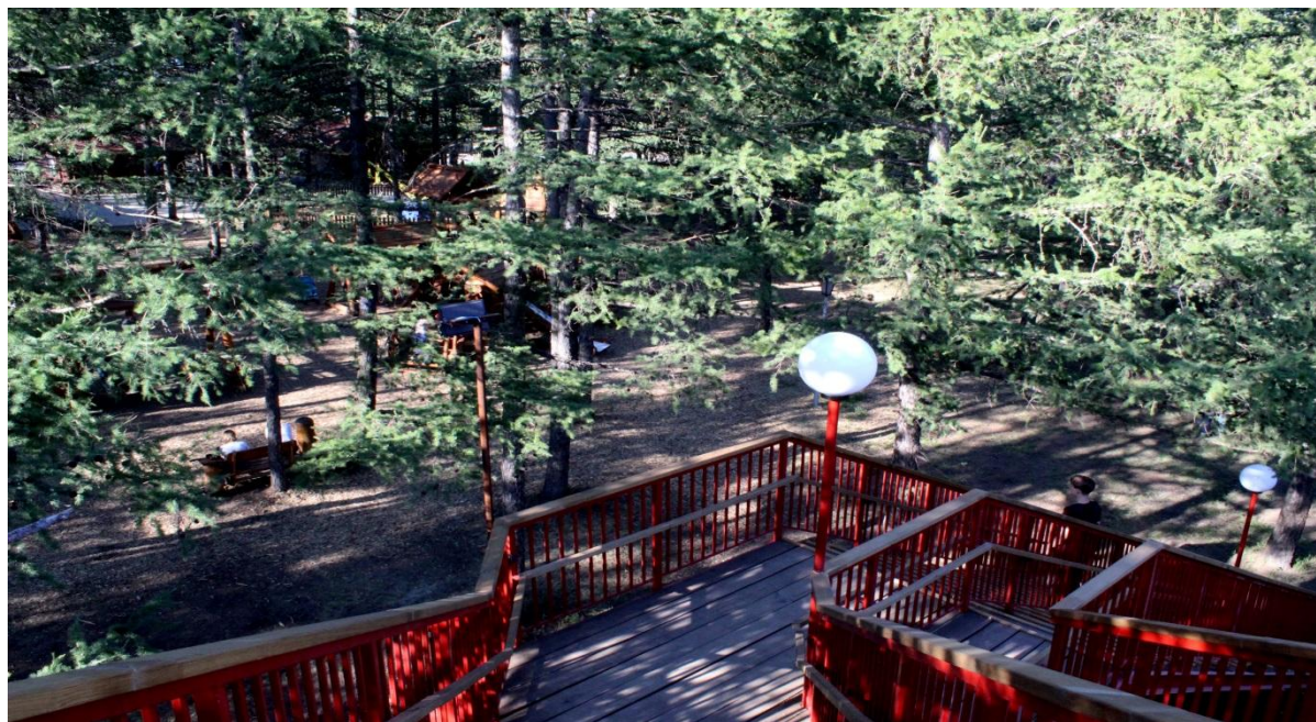
Фото.10 и 11 «Лестница ведущая на детскую площадку»