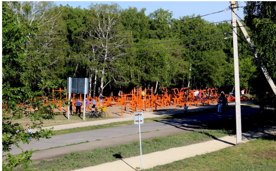
Фото.4 и 5 «Тренажеры»

Летом в экопарке настоящее раздолье для любителей активного отдыха. Спортсмены устремляются на различные тренажёры и футбольное и баскетбольное поля.