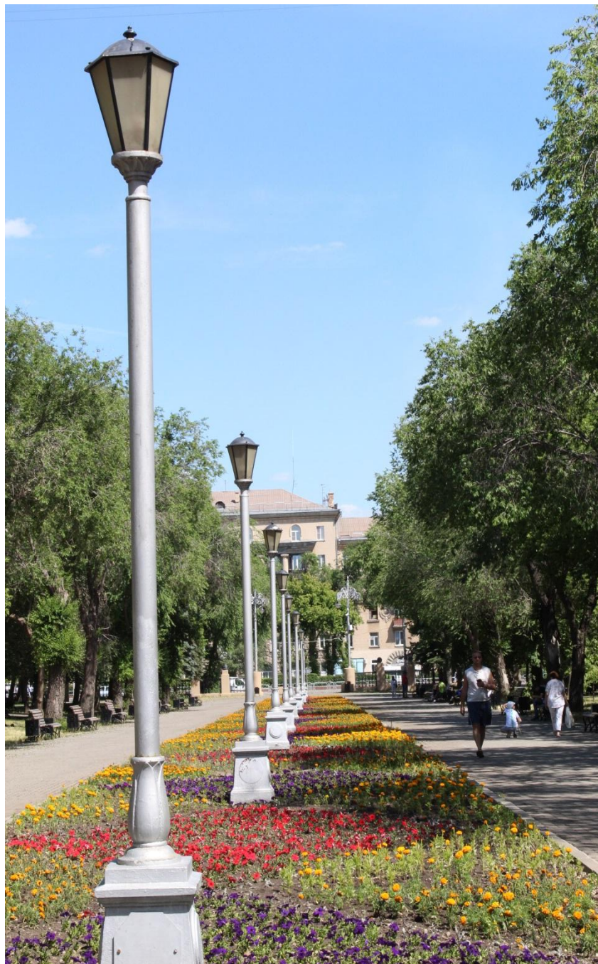
Фото.8 и 9 «Аллея»

Парк Metallургов подойдет и для неспешной прогулки по аллеям и романтических встреч, и для активного отдыха и детских развлечений.