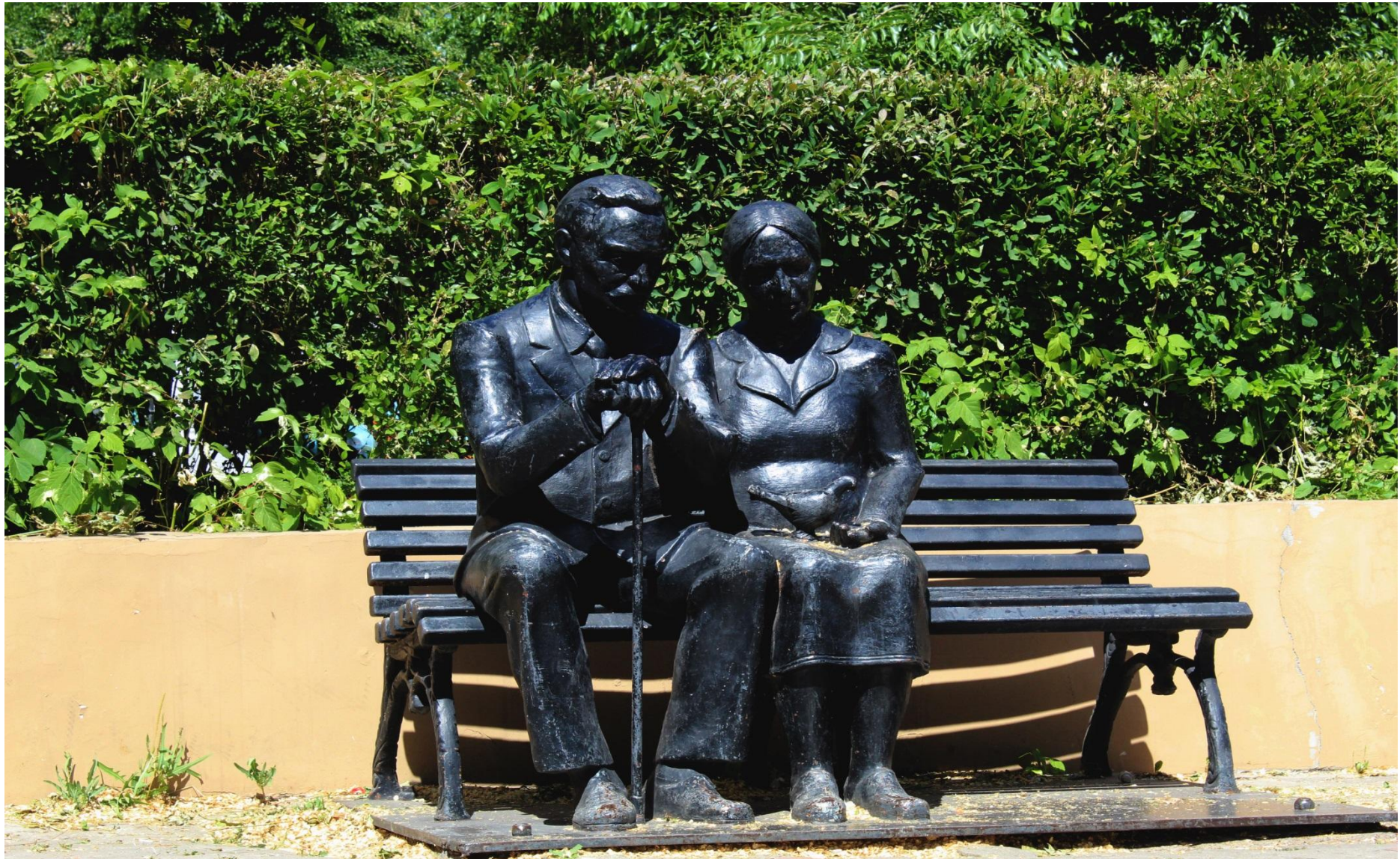
Фото.7 «Памятник родителям»

В центре сквера установлен Памятник родителям. Скульптурная композиция представляет собой вылитую из чугуна скамейку, на которой сидят фигуры престарелых отца и матери. В руках женщины голубь как символ вылетевшего из родового гнезда чада.