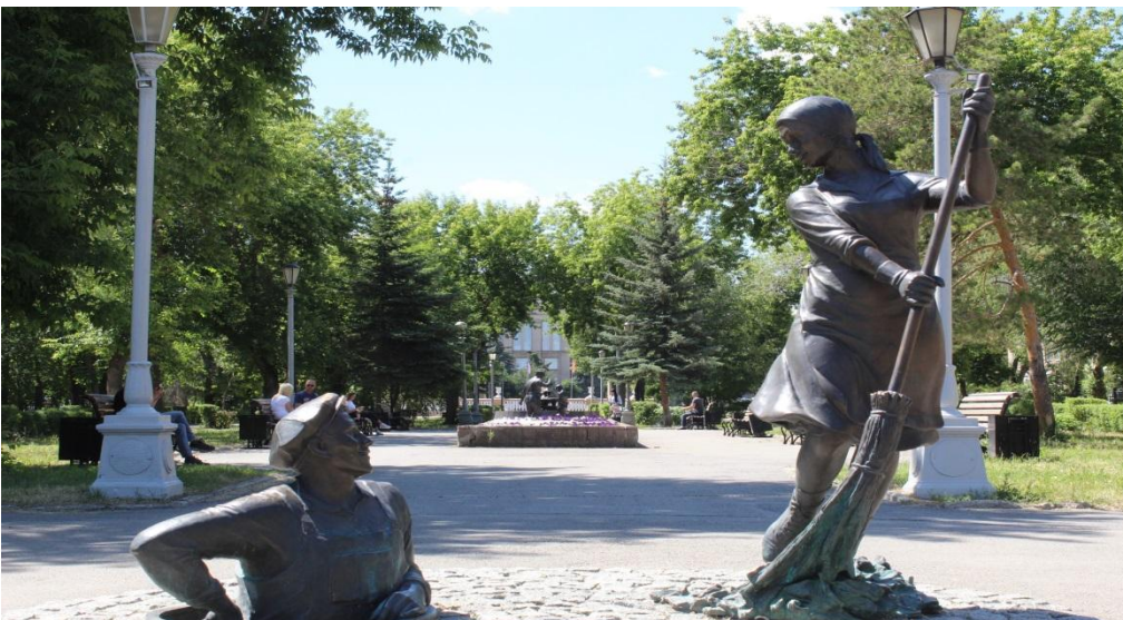
Фото.4 и 5 «Скульптуры»