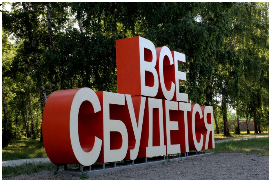
Фото.3 «Всё сбудется»

Магнитогорский экопарк — очаровательный природный уголок, разбитый в черте промышленного города.