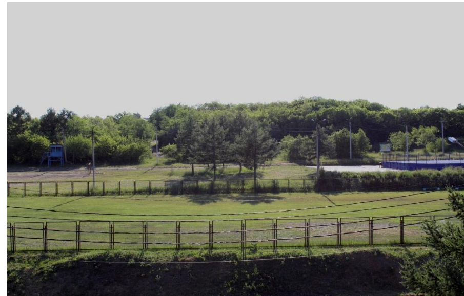
Фото.6 «Футбольное поле»