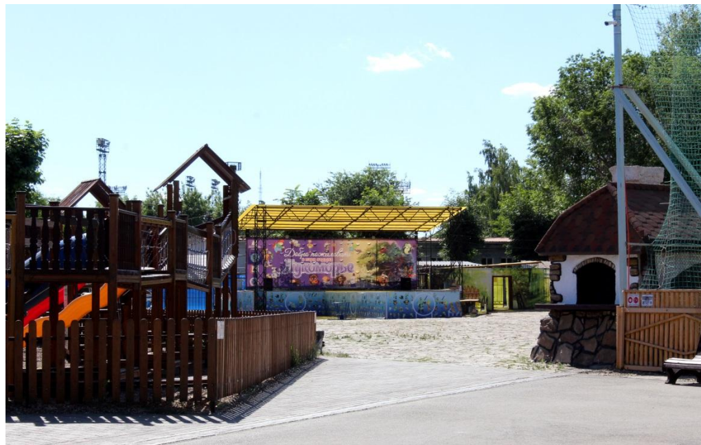
Фото.8 и 9 «Детский городок и стена»