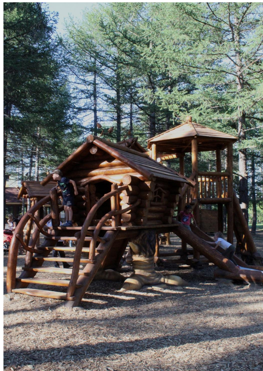
Фото.7,8 и 9 «Детская игровая площадка»