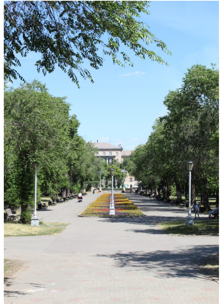
Фото.6 «Места для отдыха»