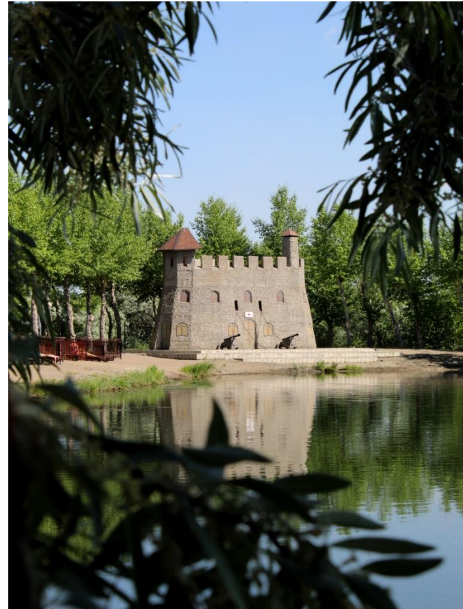
Фото.2 «Замок на берегу»

Это очень живописное местечко в лучших традициях пленера: с тихой заводью, камышами, снующими туда-сюда чайками и каменистыми берегами.