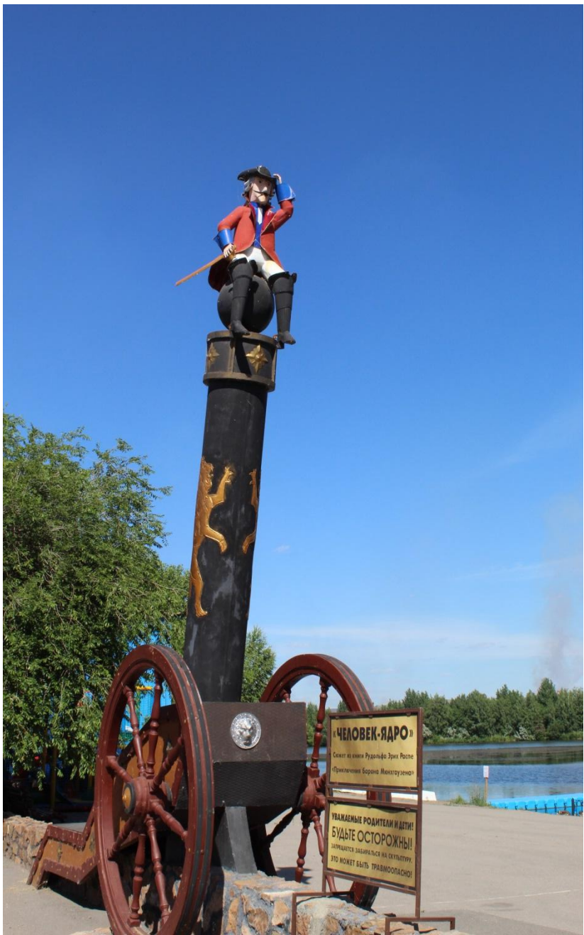
Фото.7 «Скульптура «Человек-ядро»»