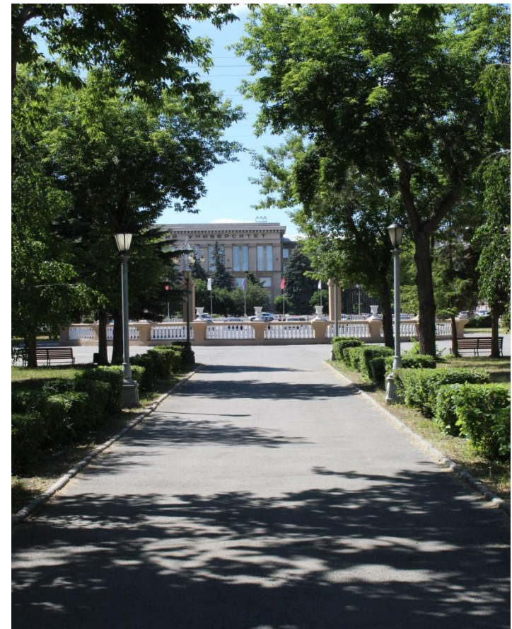
Фото.3 «Вид из парка на

В Парк расположен напротив Горного университета, проспект — визитная карточка города, символ Магнитогорска и место, которое нужно обязательно увидеть своими глазами. Украшением парка Metallургов служат фонтаны.