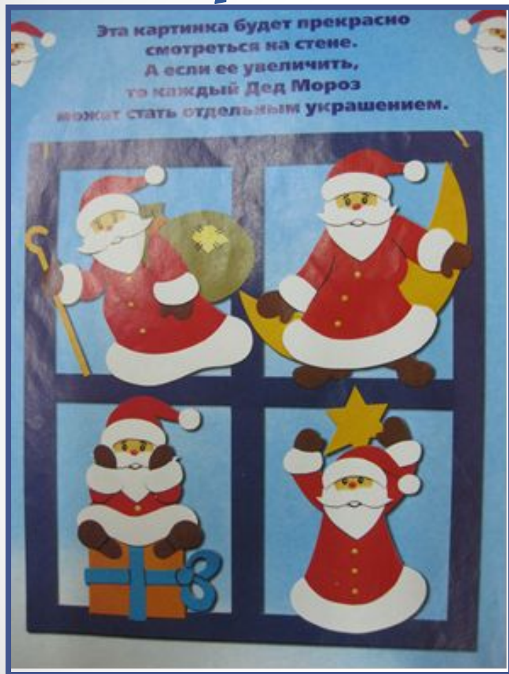
Идея № 3