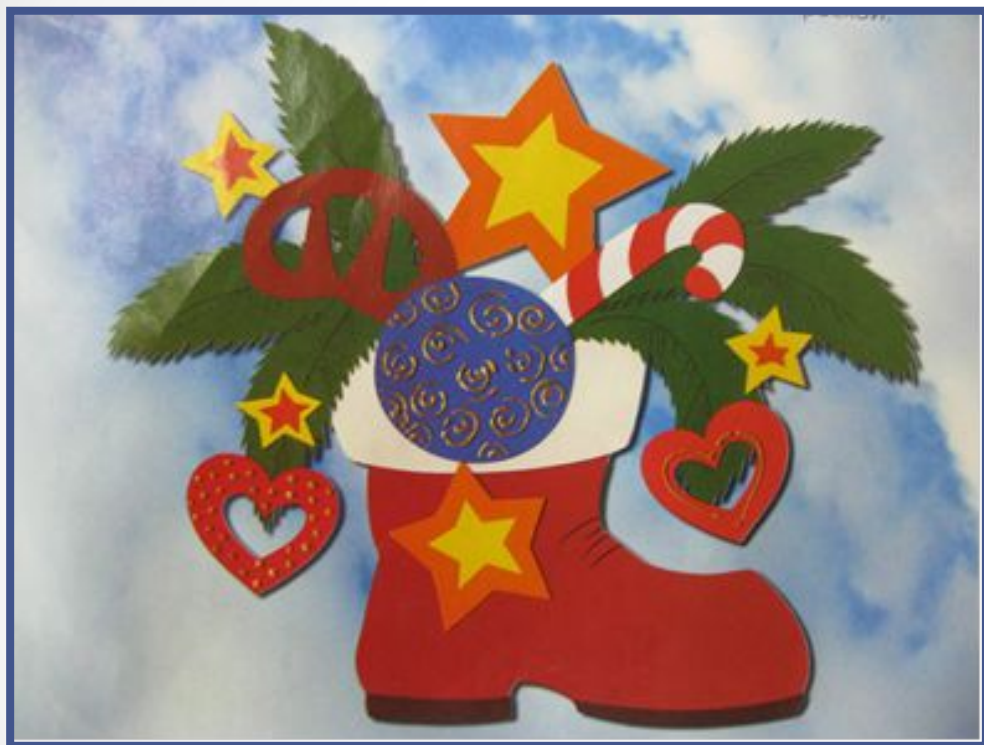
Идея № 1