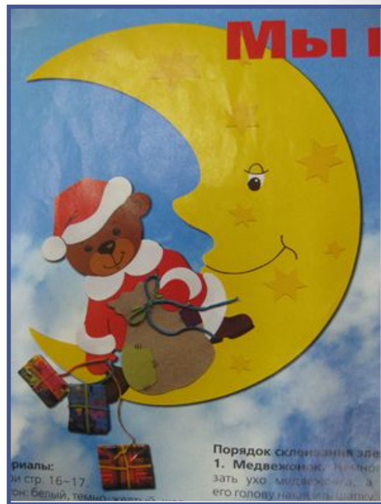
Идея № 2