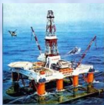
Самоходная буровая платформа