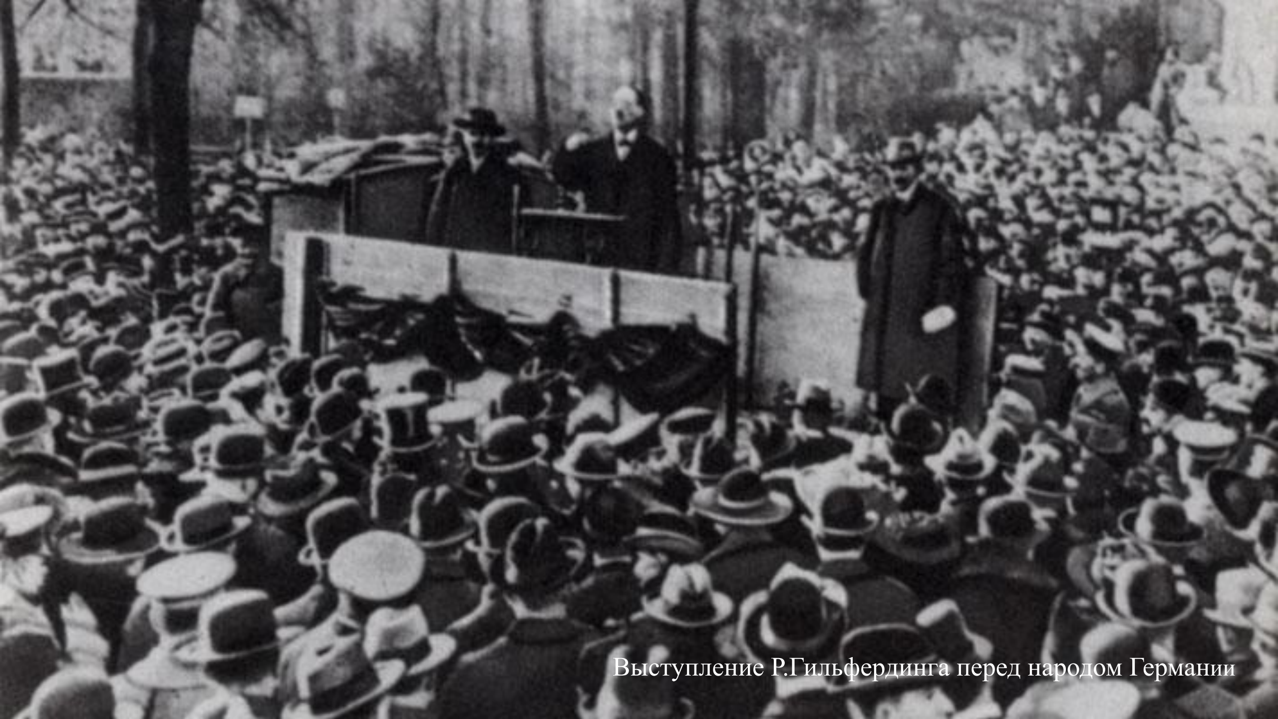
Выступление Р.Гильфердинга перед народом Германии