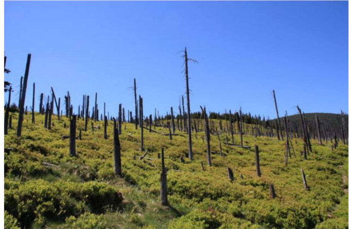
Последствия кислотного дождя, Польша