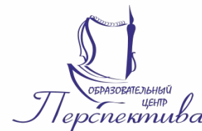
ГРАФИК ПРОВЕДЕНИЯ КОНКУРСОВ